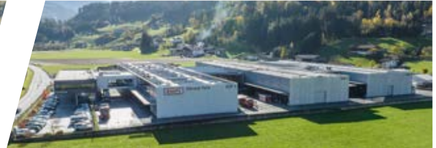
Service Park in Kaltenbach, Österreich Service Park, Austria