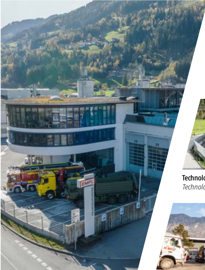
Hauptwerk in Kaltenbach, Österreich Headquarter, Austria