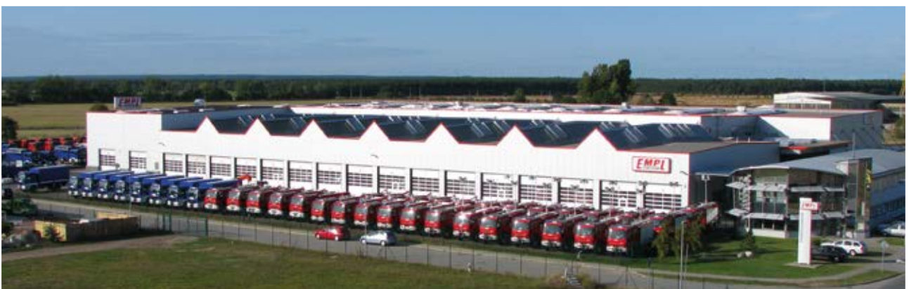
Hauptwerk in Elster, Deutschland Headquarter, Germany