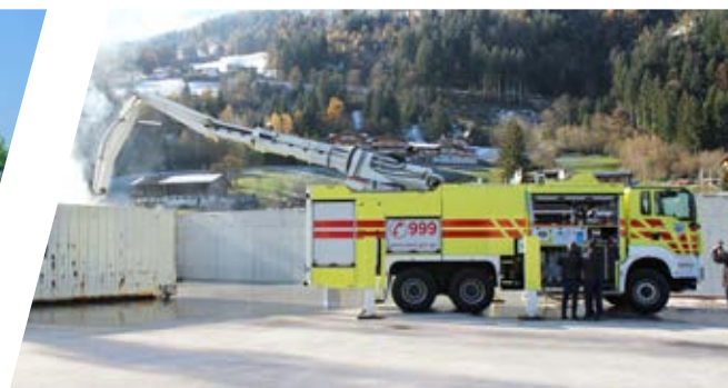
Force Entry Vehicle Force Entry Vehicle