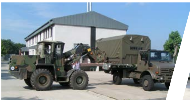
Wechselladesystem Interchangeable Body System