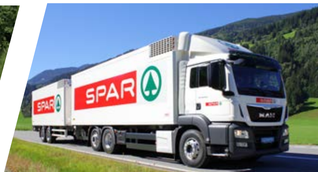
Future Truck – Kühlkoffer mit Anhänger Future Truck – Refrigerated Body with trailer