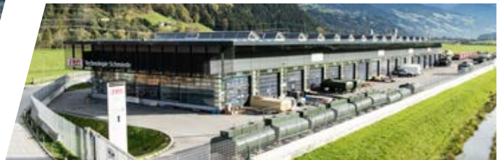
Technologie Schmiede in Uderns, Österreich Technologie Schmiede, Austria