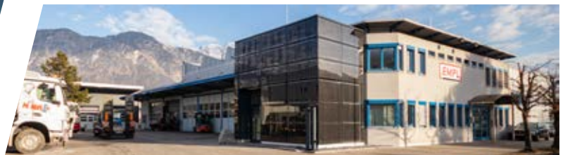
Service Werk in Hall, Österreich Service Plant, Austria