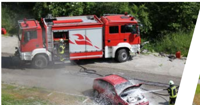
Tanklöschfahrzeug Double Head Tunnel Extinguishing Vehicle Double Head

The three different fields of activity – Fire Fighting, Commercial Vehicles and Defence & Authorities – produce a large number of cross-divisional synergies which we pass on to our customers.