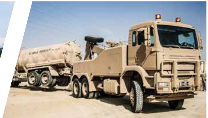
Bergefahrzeug EH/W 100 Medium Recovery Vehicle EH/W 100