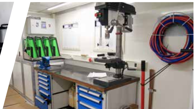
Inneneinrichtung Mobile Werkstatt Interior Mobile Workshop