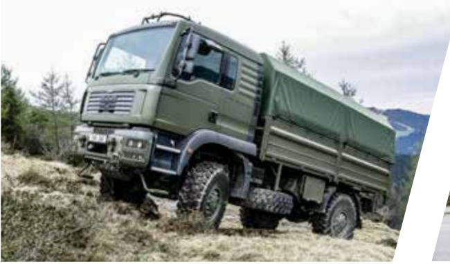
Truppentransporter Troop Carrier