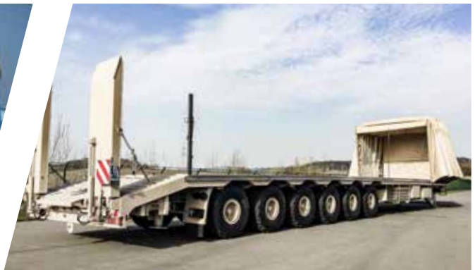
Tiefsattellader Low Bed Semi Trailer