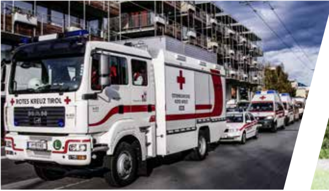
Großunfallfahrzeug Medical Rescue Vehicle for major accidents