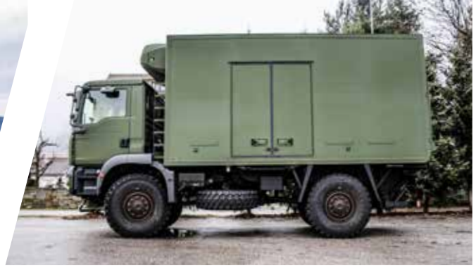
Kühlkoffer Refrigerated Body