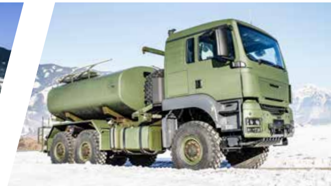
Treibstofftank 10.000 l Fuel Tank Body 10.000 l