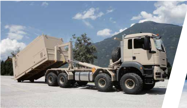
Hakenladesystem mit Flat Rack und Shelter Load Handling System with Flat Rack and Shelter