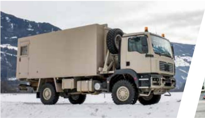
Gewehr- und Munitionsaufbau Ammunition Shelter