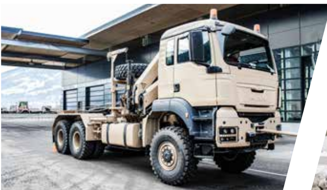
Sattelzugmaschinen mit Doppelwinden Tractor Head Equipment