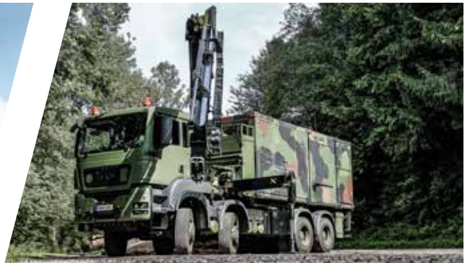
Systemaufbau für Dekontaminationsmodule System Carrier for Decontamination Module