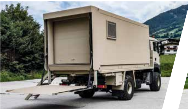
Mobiler Lager-Aufbau, wechselbar Mobile Storage Shelter, interchangeable