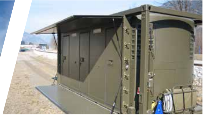
Kühlshelter mit 3 unterschiedlichen Temperatur Zonen Refrigerated Body with 3 different temperature zones