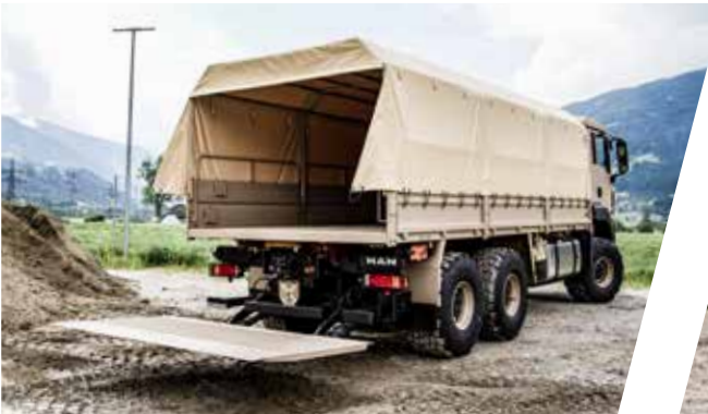
Pritsche mit Ladebordwand Cargo Body with Hydraulic Platform