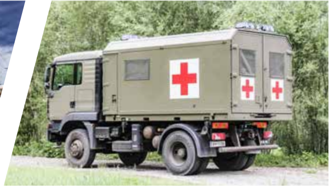
Krankentransporter, wechselbar, verwindungsfreier Rahmen Mobile Patient Transport Ambulance, interchangeable and torsion free