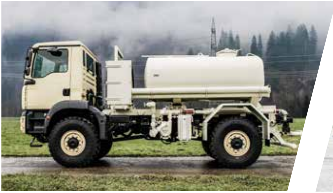
Wassertank 6.000 l Water Tank Body 6.000 l