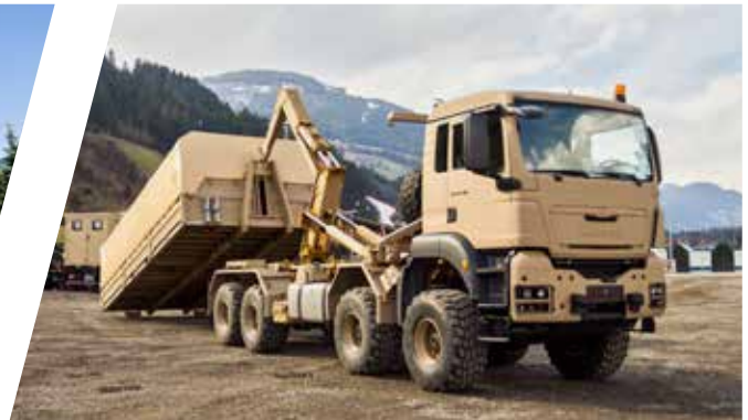
Hakenladesystem mit Flat Rack für Bergeinsätze Load Handling System with Flat Rack for Recovery Operation