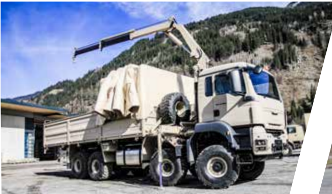
Pritsche mit Schieberdeck und Kran, verwindungsfrei Cargo Body with Sliding Tarpaulin Rack and Crane, torsion free