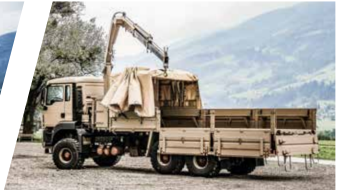
Truppentransporter mit Schieberdeck und Kran, verwindungsfrei Troop Carrier with Sliding Tarpaulin Rack and Crane, torsion free