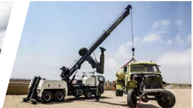
Schweres Bergefahrzeug EH/W 200 SBV Heavy Duty Recovery Vehicle EH/W 200 SBV