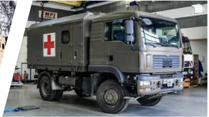
Krankentransporter, wechselbar, verwindungsfreier Zwischenrahmen Mobile Patient Transport Ambulance, interchangeable and torsion free