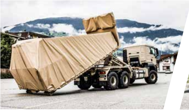
Hakenladesystem mit Flat Rack Load Handling System with Flat Rack