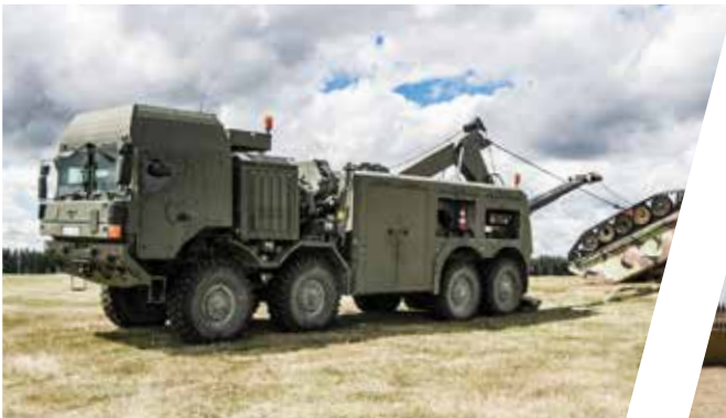
Schweres Bergefahrzeug EH/W 200 Bison mit Kran Heavy Duty Recovery Vehicle EH/W 200 Bison with crane