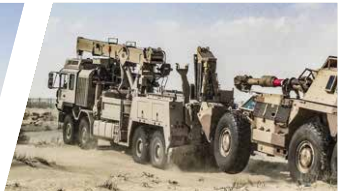
Bergekräne EH/TC 53.000 - G6 Recovery Recovery Cranes EH/TC 53.000 - G6 Recovery