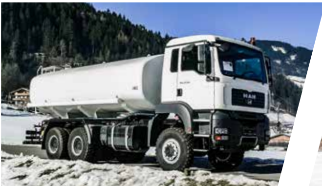
Treibstofftank mit Safe-Tank System 10.000 l Fuel Tank Body with Safe-Tank System 10.000 l