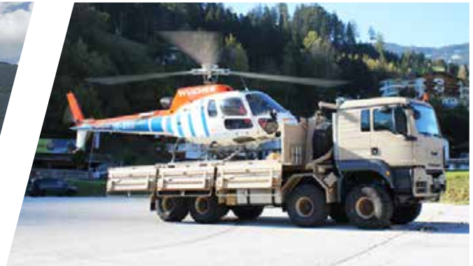
Hakenladesystem mit Flat Rack Load Handling System with Flat Rack