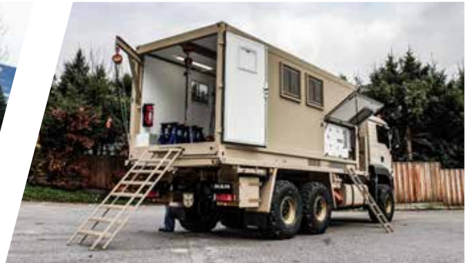
Mobiler Werkstatt-Shelter, wechselbar Mobile Workshop Shelter, interchangeable