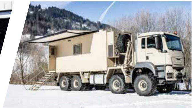
Kommando Aufbau Command and Control Body