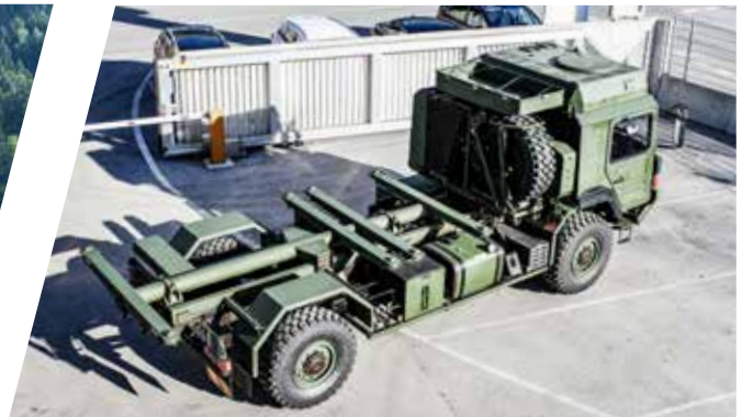
Containerrahmen, verwindungsfrei Shelter Frame, torsion free