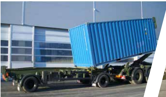
Schlitten-Anhänger Trailer with Sliding Tray