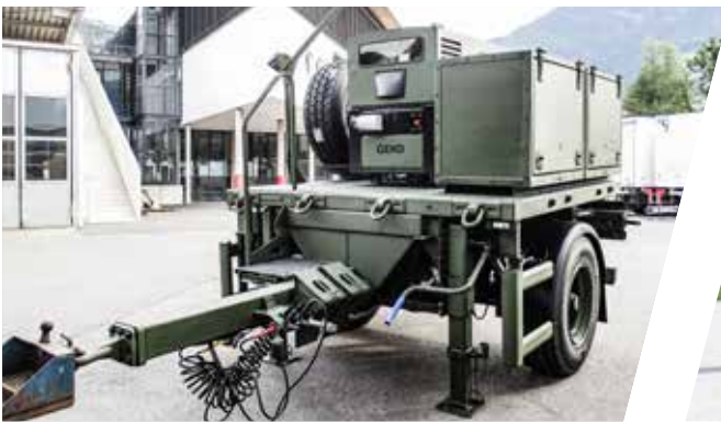
Generator-Anhänger Generator Trailer