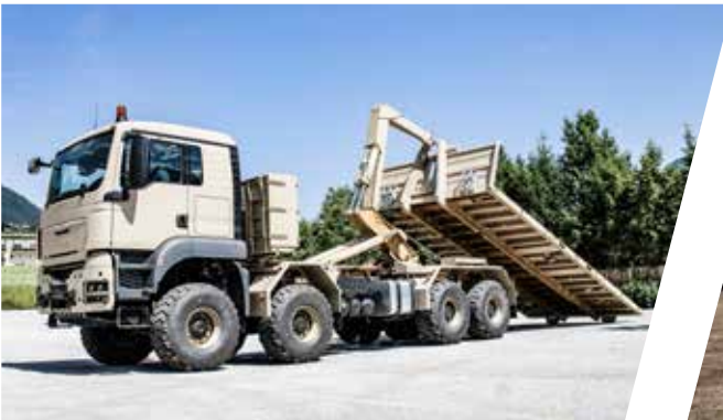
Hakenladesystem mit Flat Rack für Bergeinsätze Load Handling System with Flat Rack for Recovery Operation