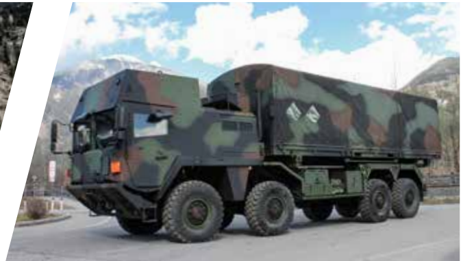
Wechselpritsche Interchangeable Cargo Body