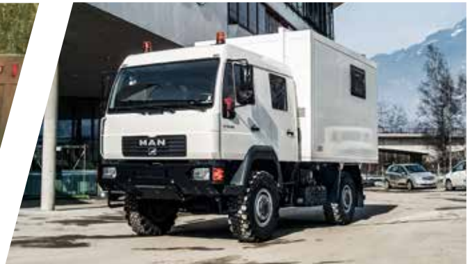
Krankentransportwagen Mobile Patient Transport Ambulance