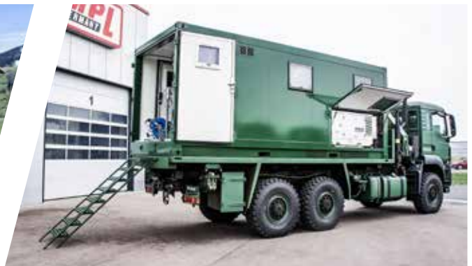
Mobiler Werkstatt-Shelter, wechselbar Mobile Workshop Shelter, interchangeable