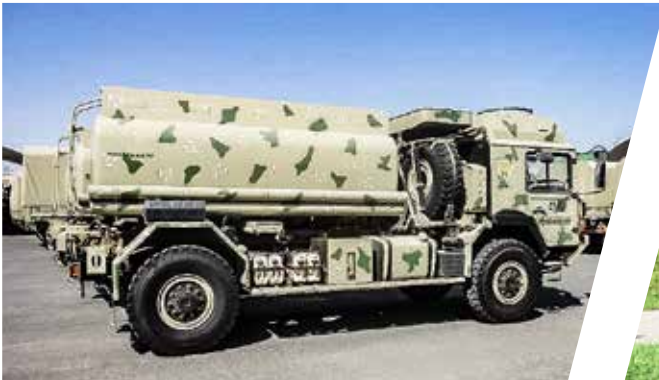
Treibstofftank 6.500 l Fuel Tank Body 6.500 l