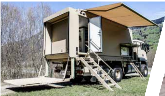
Ersatzteil-Shelter, wechselbar Spare Parts Shelter, interchangeable