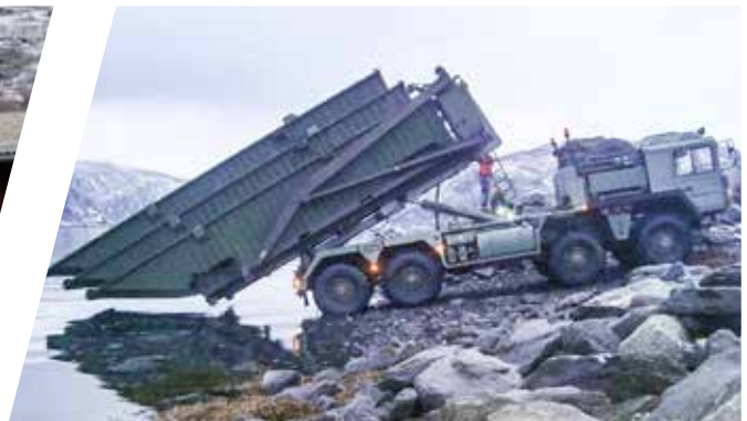
Hakenladesystem mit Flat Rack für Wasserung / Rückholung von Pontons Load Handling System with Flat Rack for Launching / Recovering of Pontoons