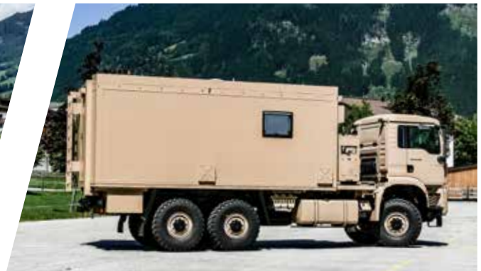
Kommando Shelter Command and Control Shelter