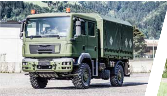
Wechselsystem Truppentransport Interchangeable Body System with Troop Carrier