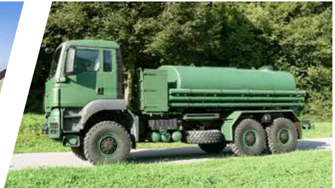
Wassertank 10.000 l Water Tank Body 10.000 l