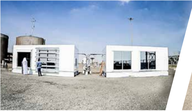
Laborcontainer Laboratory Container