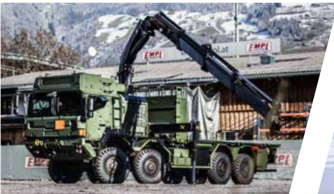
Systemaufbau für Dekontaminationsmodule System Carrier for Decontamination Module