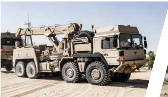
Bergekräne EH/TC 80.000 Recovery Cranes EH/TC 80.000