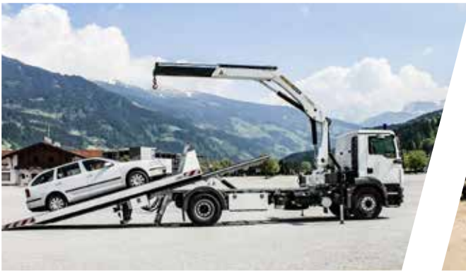
Schiebepalette Sliding Platform