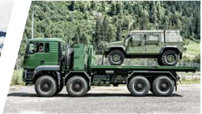
Hakenladesystem mit Flat Rack für Bergeinsätze Load Handling System with Flat Rack for Recovery Operation