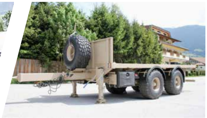
Zentral-Achs-Anhänger Tandem Trailer