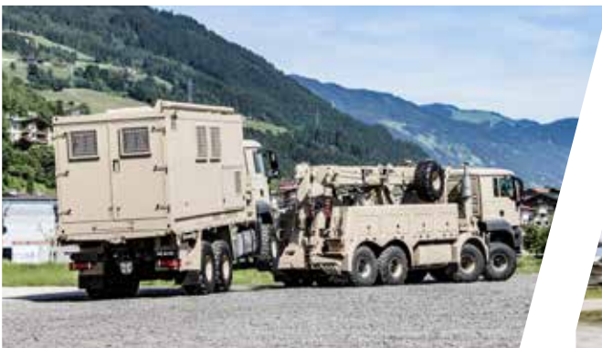
Schweres Bergefahrzeug mit Bergekrane EH/W-TC 200 TAURUS Heavy Duty Recovery Vehicle with Crane EH/W-TC 200 Taurus