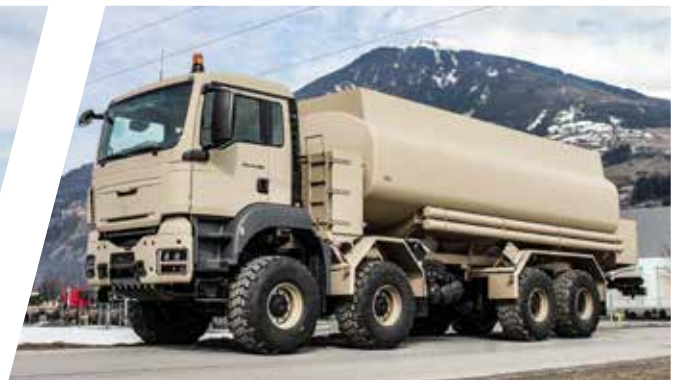
Wassertank 22.500 l Water Tank Body 22.500 l