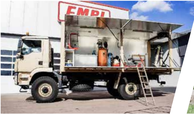
Reifenreparatur-Aufbau Tyre Repair Workshop Body