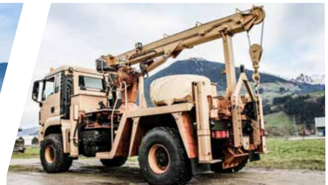
Bergekräne EH/TC 16.000 Recovery Cranes EH/TC 16.000