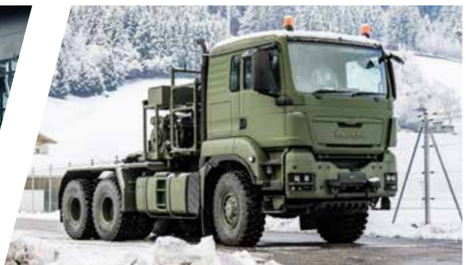
Sattelzugmaschinen mit Doppelwinden Tractor Head Equipment