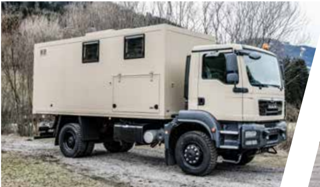
Mobile Werkstatt Mobile Workshop