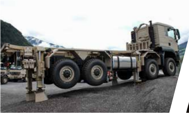
Nivelliersystem Stabilising Truck System