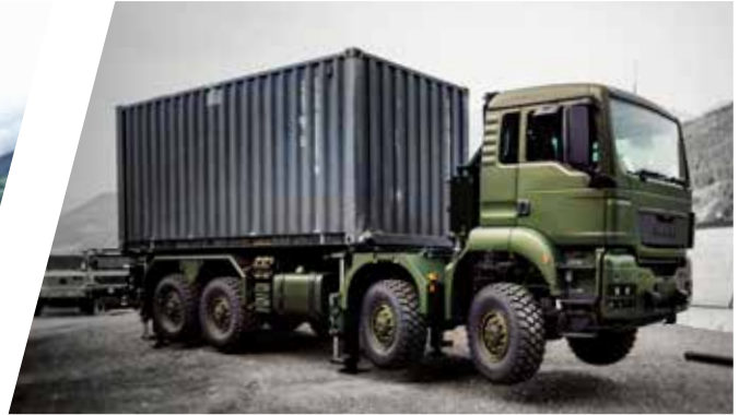
Nivelliersystem Stabilising Truck System