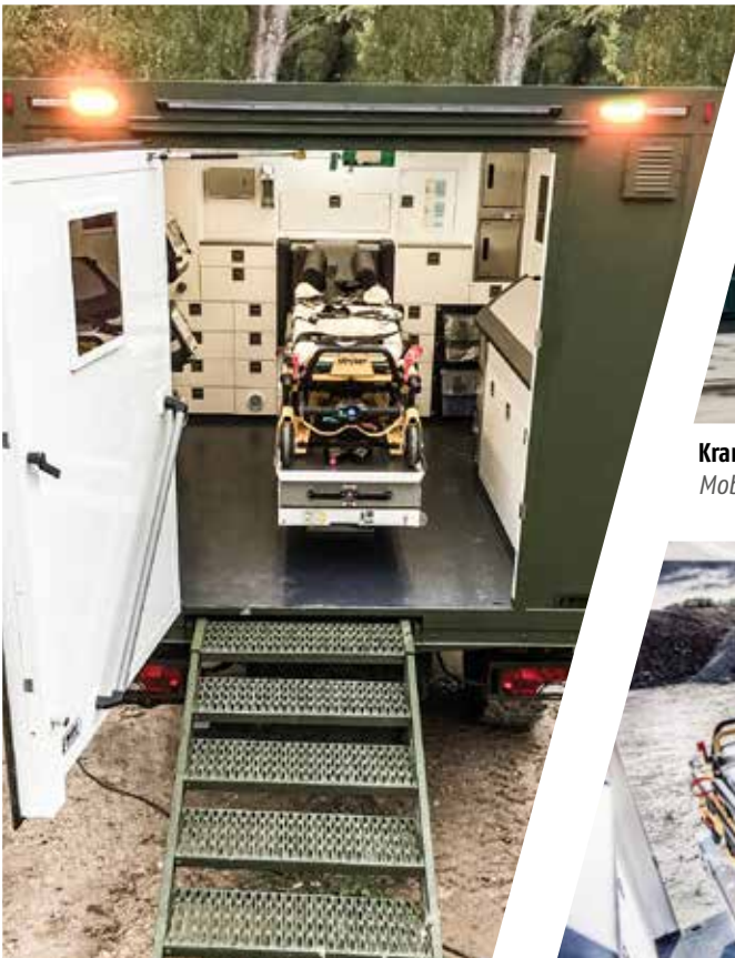
Inneneinrichtung Mobiler Notarztwagen Interior Mobile Emergency Doctor Vehicle