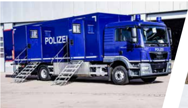
Toilettenkraftwagen Mobile Lavatory