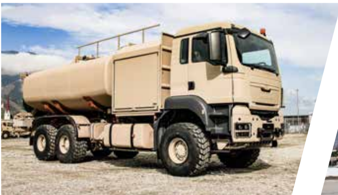
Flugfeldtankwagen 17.000 l Aircraft Refueller 17.000 l