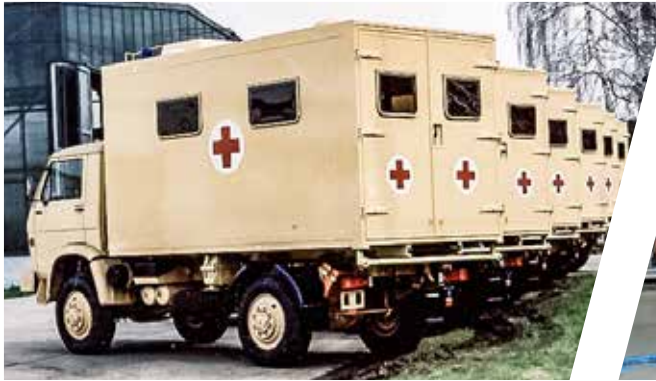
Krankentransporter Mobile Patient Transport Ambulance