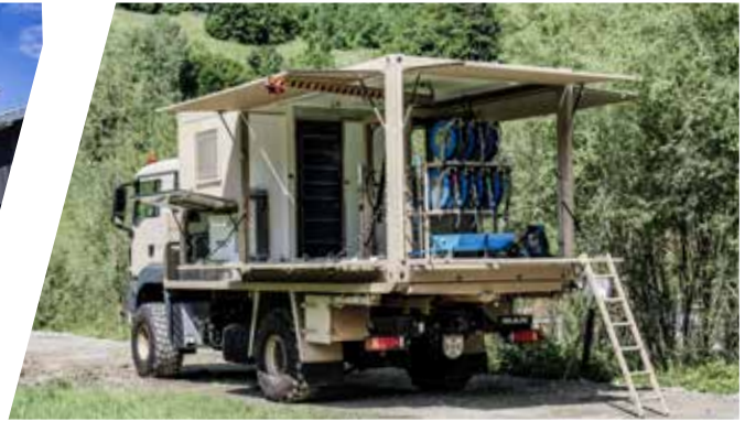
Schmierdienstshelter, wechselbar auf verwindungsfreier Plattform Lubrication Shelter, interchangeable on torsion free platform