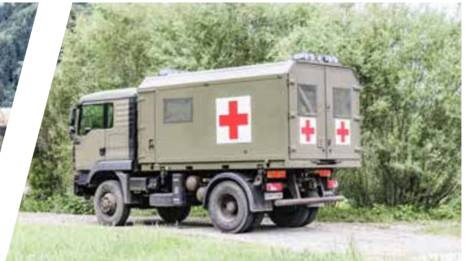
Wechselsystem Krankentransportaufbau Interchangeable Body System with Mobile Patient Ambulance Body