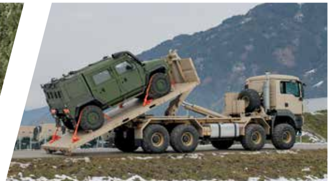
Hakenladesystem mit Flat Rack für Bergeinsätze Load Handling System with Flat Rack for Recovery Operation