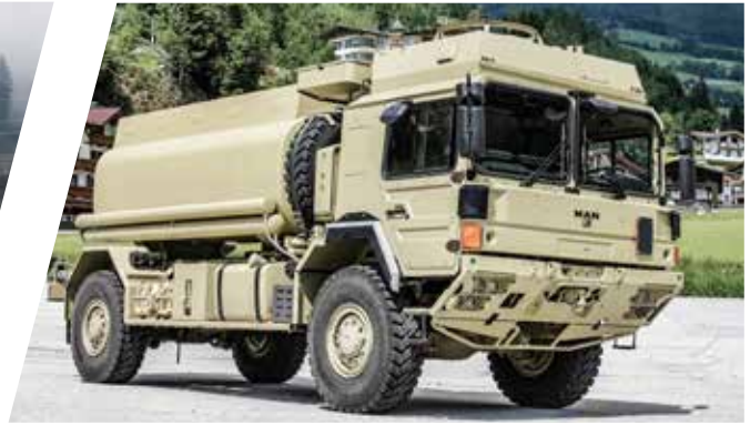
Wassertank 6.000 l Water Tank Body 6.000 l