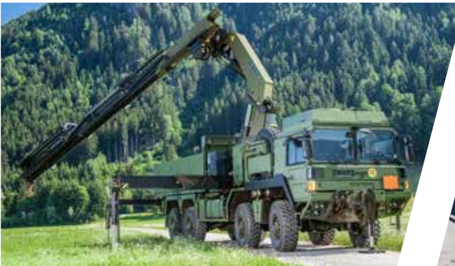
Pritsche mit Schwerkran Cargo Body with Crane