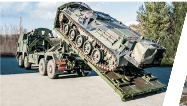
Hakenladesystem mit CHU und Flat Rack Load Handling System with CHU and Flat Rack