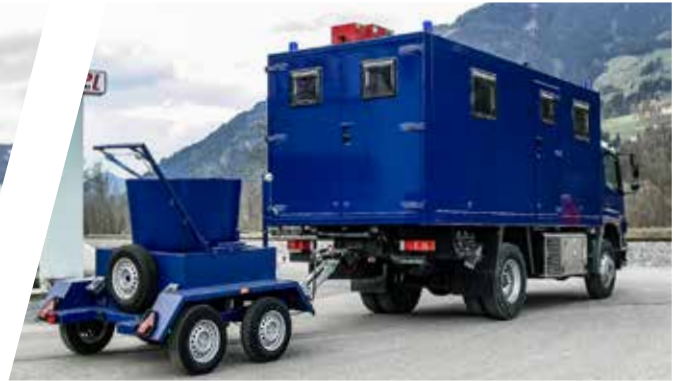
Kommandoaufbau mit Munitionsbergungsroboter Control Body with explosive ordnance disposal robot