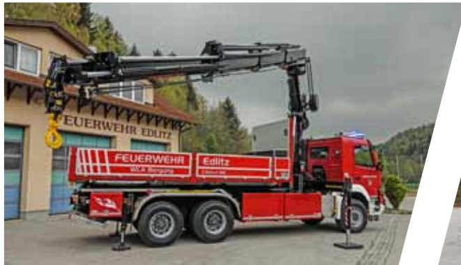
Wechselladefahrzeug mit Kran, WLF-K Hook Loading System with crane