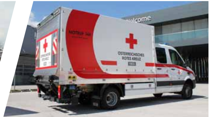
Lastenfahzeug, LAST Transport Vehicle