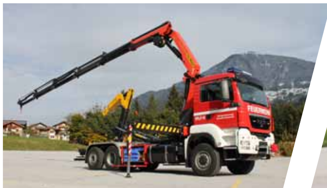
Wechselladefahrzeug mit Kran, WLF-K Hook Loading System with crane