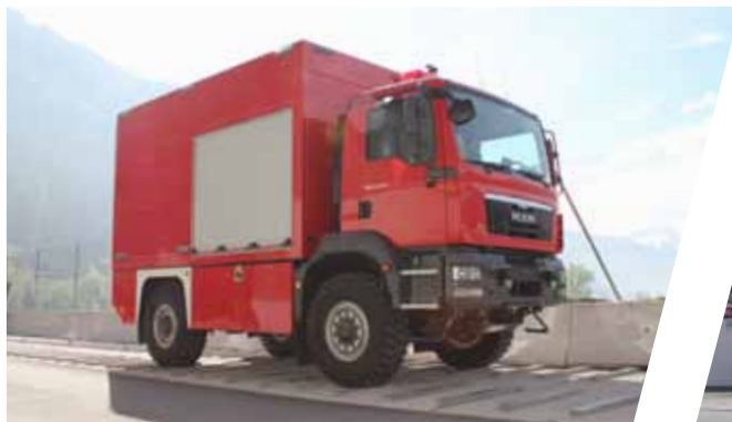
Rütteltest Vibration test

Acceptance and training with the customer