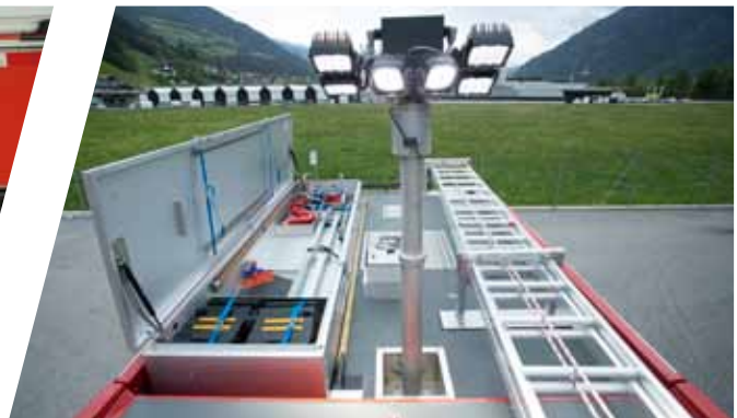
Begehbare Aufbau- und Kabinendach Walk-on body and compartment roof