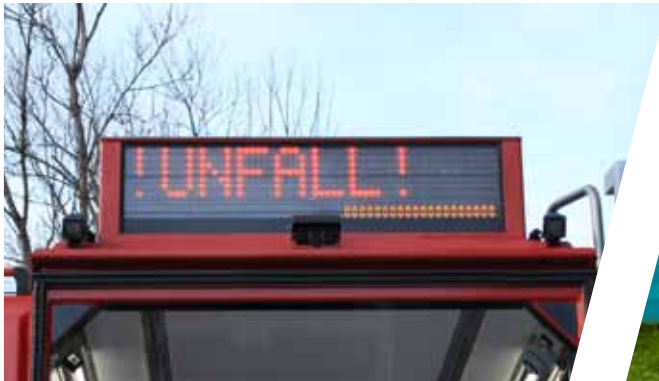
Verkehrsleiteinrichtung Rear warning system