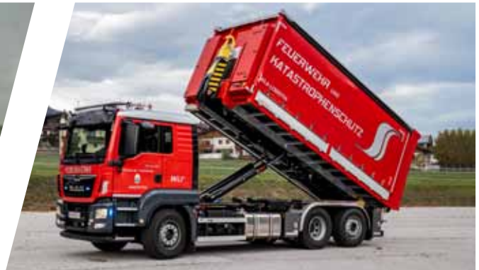
Wechselladefahrzeug, WLF Hook Loading System