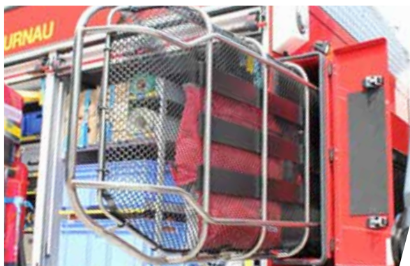
Rettungstrage für Bergereinsätze Stretcher for rescue operations