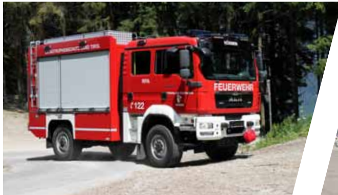
Rüstfahrzeug, RF Rescue Vehicle