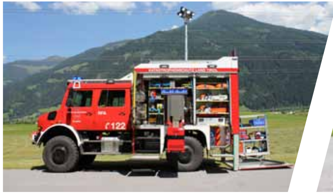
Rüstfahrzeug, RF Rescue Vehicle