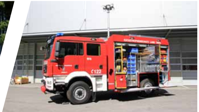
Rüstfahrzeug, RF Rescue Vehicle