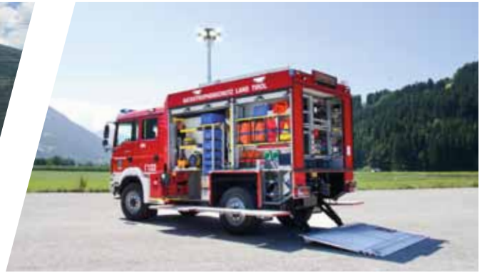
Rüstfahrzeug, RF Rescue Vehicle