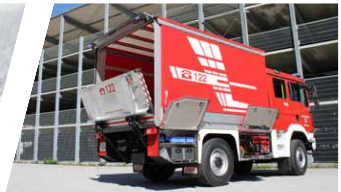
Versorgungsfahzeug, VF Supply Vehicle