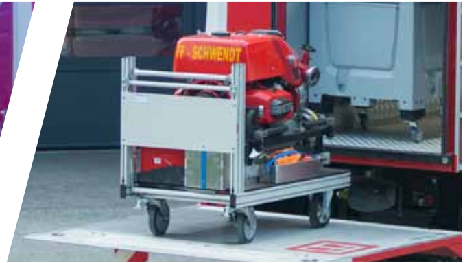
Pumpen- & Schlauch-Modul Pump & hose module