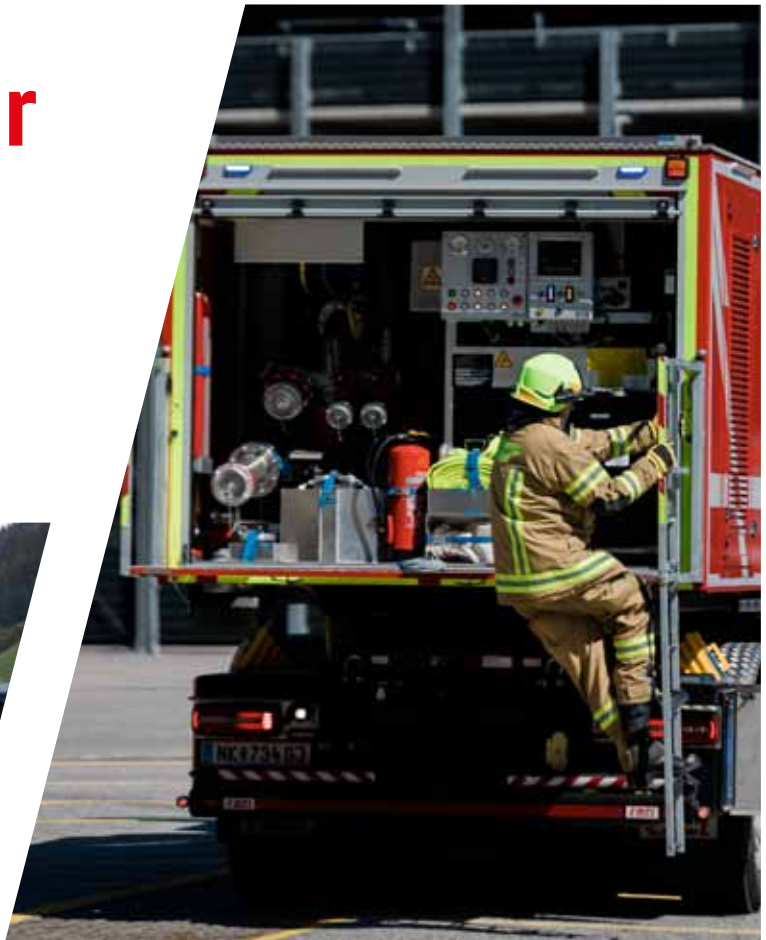
Abrollbehälter mit Wasser / Schaum Tank Roll-off Container with water / foam tank