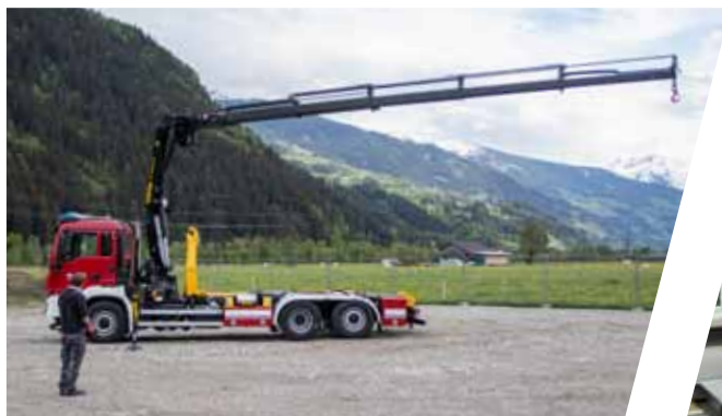
Kraneinstellung Crane setting