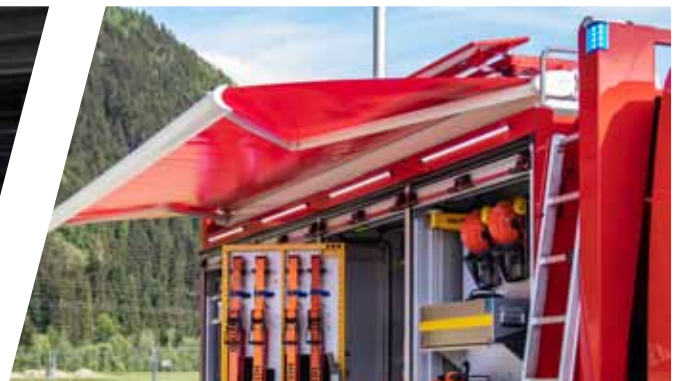
Ausfahrbare Markise Extendable awning