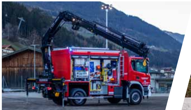
Schweres Rüstfahrzeug mit Kran, SRF-K Heavy Rescue Vehicle with crane