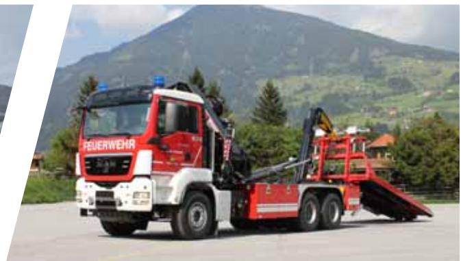
Wechselladefahrzeug mit Kran, WLF-K Hook Loading System with crane