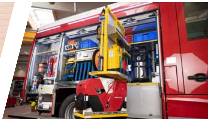
Drehwände variabel, getrennt oder durchgehend Swing-out walls