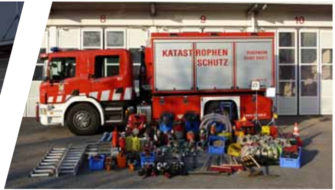
Abrollbehälter Katastrophenschutz Roll-off Container for disaster management