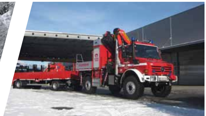
Versorgungsfahzeug mit Kran, VF Supply Vehicle with crane