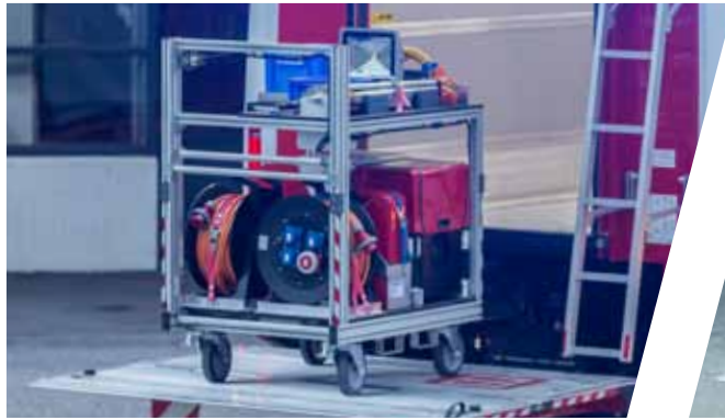
Notstrom- & Licht-Modul Emergency power & lighting module