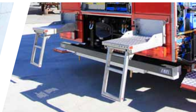
Variable Aufstiegsstufen Individual access steps