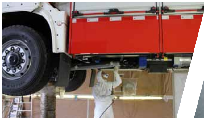
Langanhaltender Schutz durch professionelle Konservierung Durable protection due to professional conservation