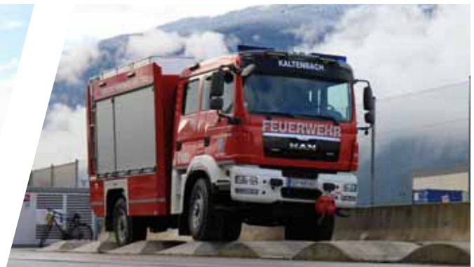
Verwindungstest Torsion test