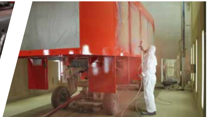
Hochwertige Aufbaulackierung High-quality body coating