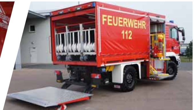
Ladungssicherung ohne Spanngurte möglich Load securing without tensioning belts