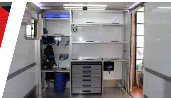
Kundenspezifischer Innenausbau Customised interior construction