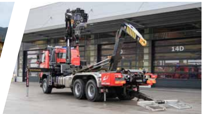
Wechselladefahrzeug mit Kran und Abschleppbrille, WLF Hook Loading System with crane and wheel lift