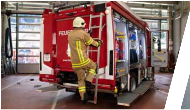
Selbstarretierende Heckaufstiegsleiter mit Schrägstellung Self-locking rear ladder held in a slant position