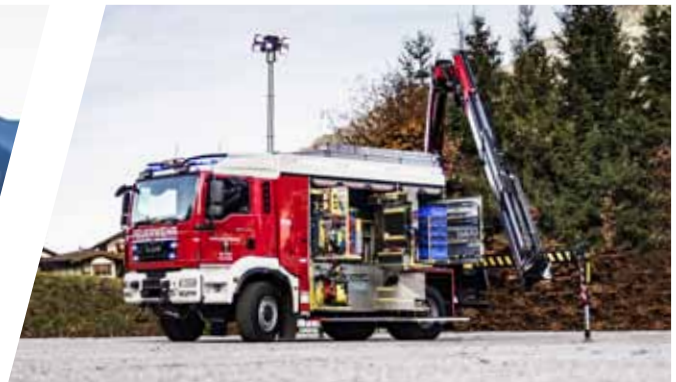
Schweres Rüstfahrzeug mit Kran, SRF-K Heavy Rescue Vehicle with crane