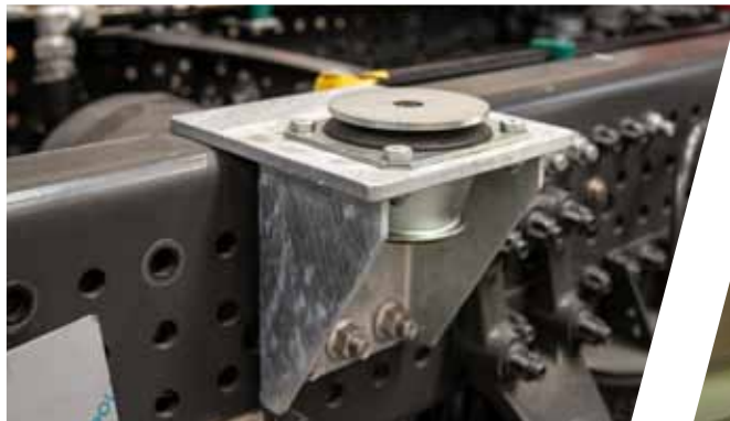
Lagerungskonsole Aufbau Supporting point for the body

We conserve both your body and also the chassis in a 2-layer process to military standard.