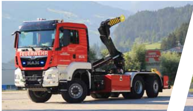
Wechselladefahrzeug, WLF Hook Loading System