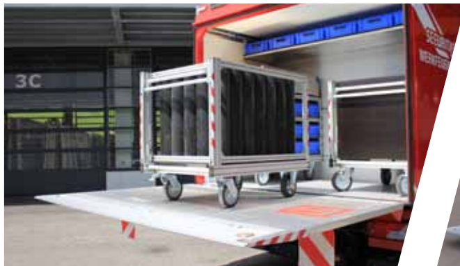
Rollcontainer – Atemschutz Modul Respiratory protection module