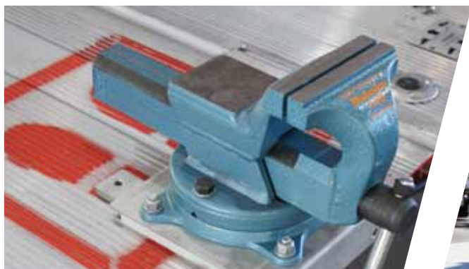
Schraubstock befestigt an Ladebordwand Vice mounted on tail-lift