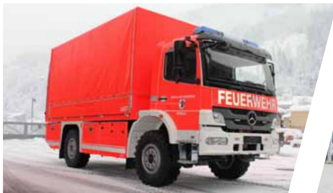
Lastenfahzeug, LAST Transport Vehicle