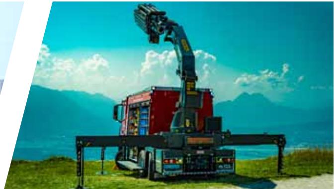
Heckkran Rear crane