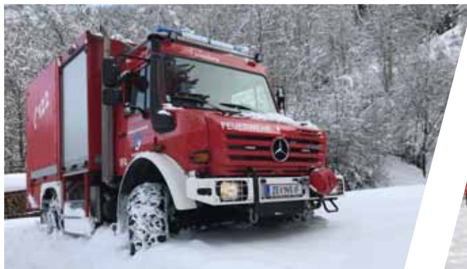
Versorgungsfahzeug, VF Supply Vehicle