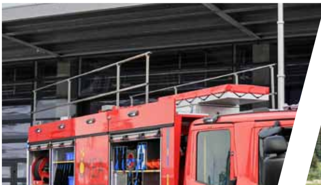
Dachgeländer Roof railing