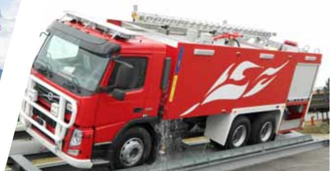
Kipptest Tipping test