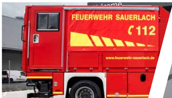
Seitlicher Türeingang Side door