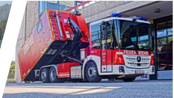
Wechselladefahrzeug, WLF Hook Loading System