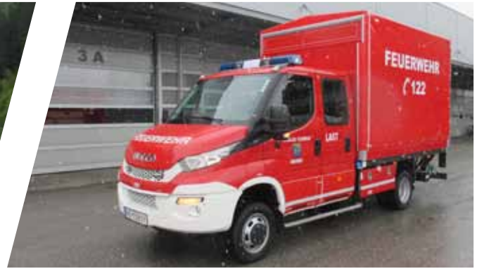
Lastenfahzeug, LAST Transport Vehicle