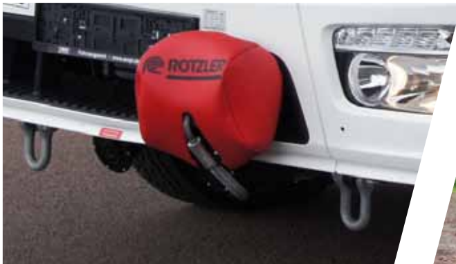
Rahmeneinbauwinde Frame winch