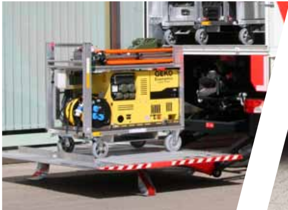
Rollcontainer mit Generator Roll-on containers with generator