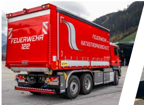
Abrollbehälter Logistik Roll-off Container logistic