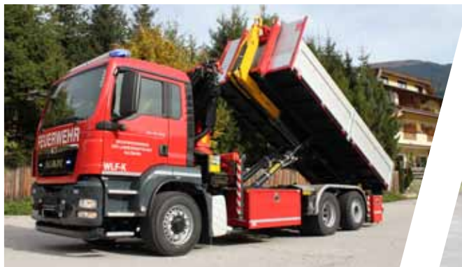
Wechselladefahrzeug mit Kran, WLF-K Hook Loading System with crane