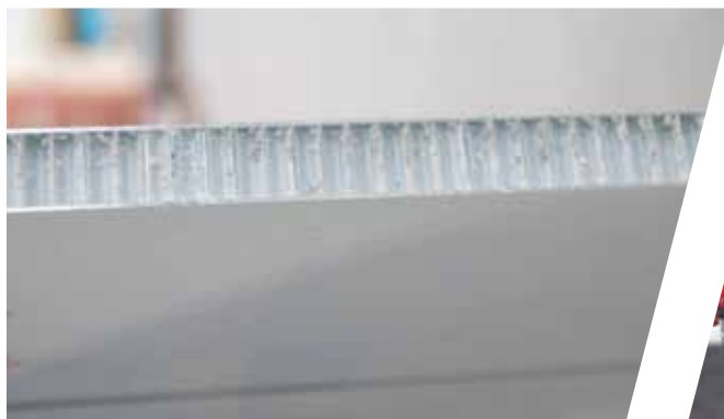
Wabenkernpaneel Honeycombed panels