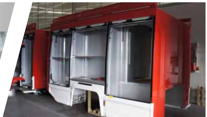
Aufbau aus kunststoffbeschichteten Aluminium Sandwich-Paneelen Body made of aluminium sandwich panels