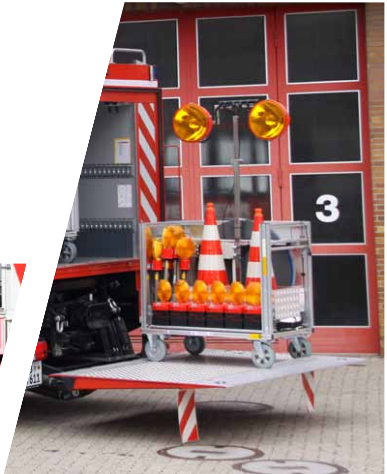
Rollcontainer mit Verkehrssicherheitsausrüstung Roll-on containers with traffic safety equipment