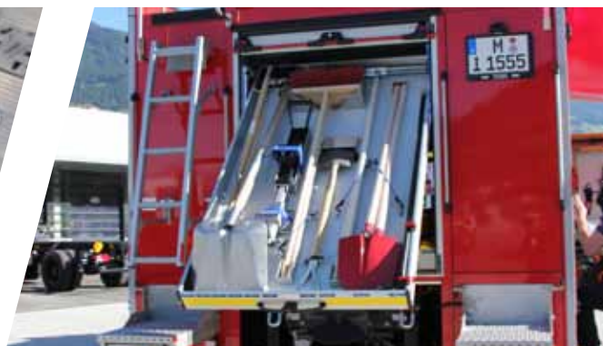
Individueller Heckauszug Individual rear extension