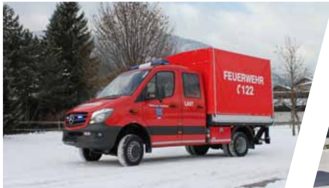
Lastenfahzeug, LAST Transport Vehicle