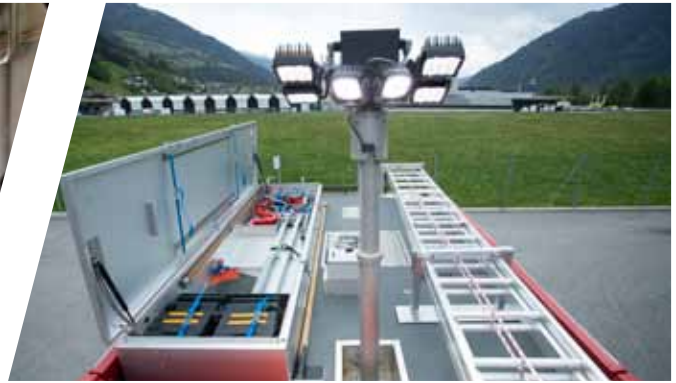
Lichtmast EMPL Function Light Lightmast EMPL Function Light