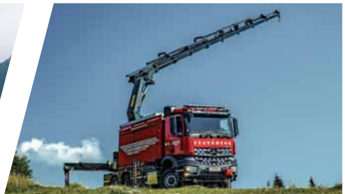
Schweres Rüstfahrzeug mit Kran, SRF-K Heavy Rescue Vehicle with crane