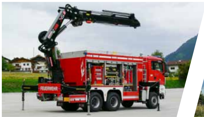
Schweres Rüstfahrzeug mit Kran, SRF-K Heavy Rescue Vehicle with crane