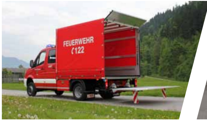
Lastenfahzeug, LAST Transport Vehicle