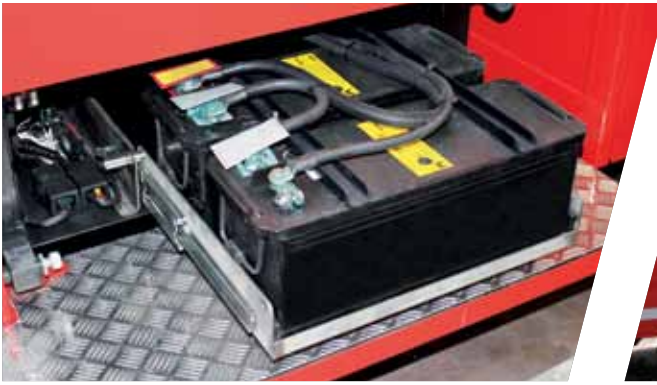
Batterien auf Edelstahlauszug hinter Trittstufen Batteries behind the fold-out step on a stainless steel extension