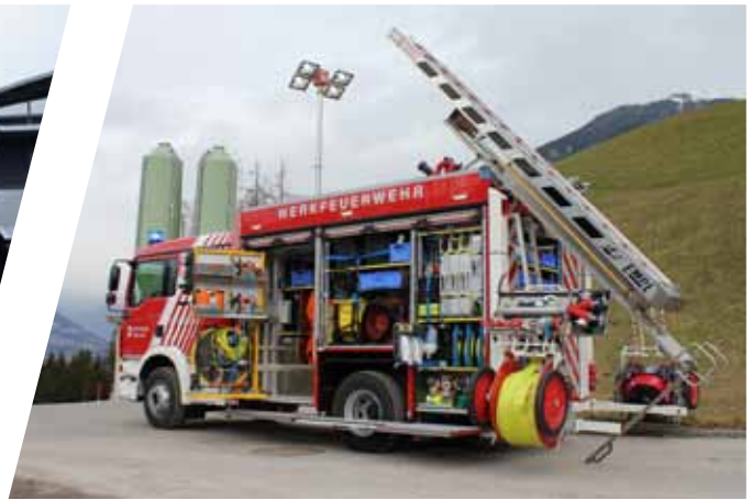
Mittleres Löschfahrzeug, MLF Medium-size Fire Fighting Vehicles, MLF