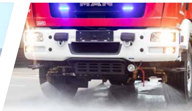
Straßenwasch- und / oder Selbstschutzanlage Street washing nozzles