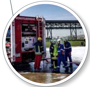
Abnahme und Einschulung mit dem Kunden Acceptance and training with the customer