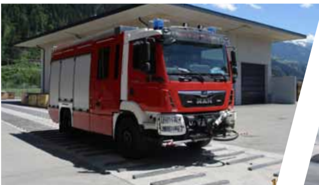
Rütteltest Vibration test