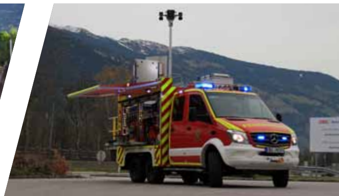
Ausfahrbare Markise Extendable awning