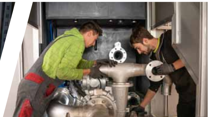
gesamte Verrohrung in Edelstahl-Schweißkonstruktion entire pipework in welded stainless steel design