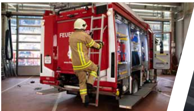
Selbstarretierende Heckaufstiegsleiter mit Schrägstellung Self-locking rear ladder held in a slant position