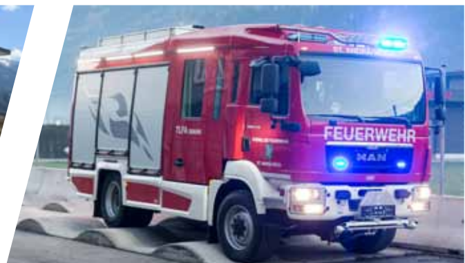
Verwindungstest Torsion test