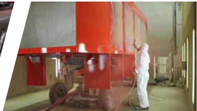
Hochwertige Aufbaulackierung High-quality body coating