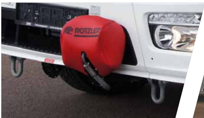
Winde einfach / Doppelzug Winch single / double hoist