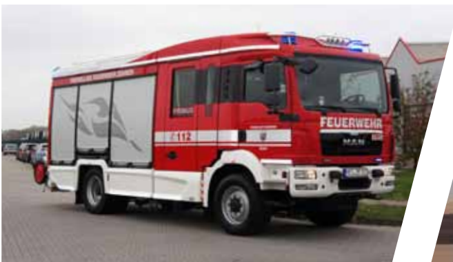
Hilfeleistungslöschgruppenfahrzeug, HLF 20 Pumper with rescue equipment, HLF 20