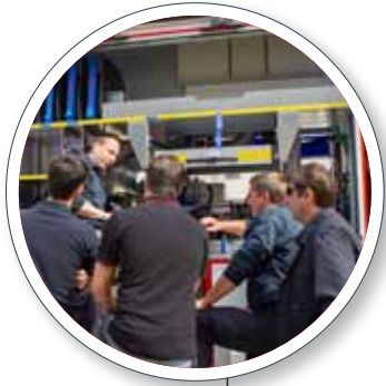
Rohbaubesprechung Intermediate manufacture meeting