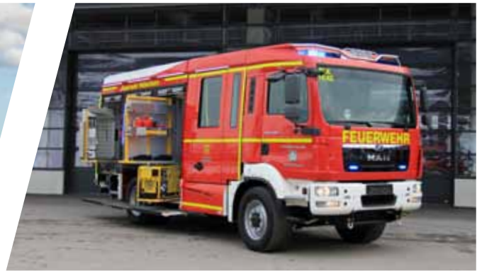
Löschgruppenfahrzeug, LF 10 Pumper, LF 10