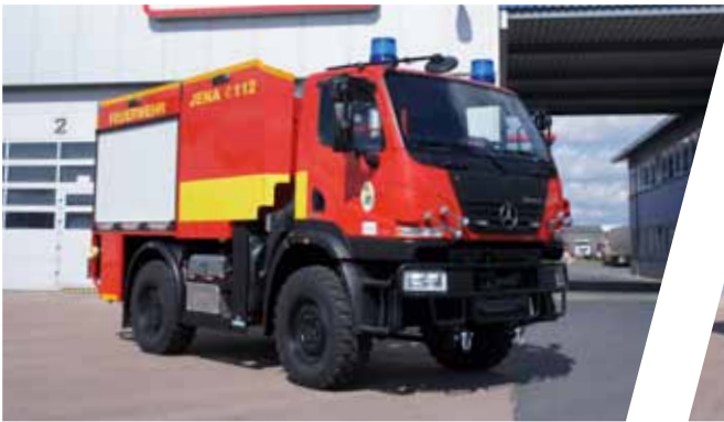
Tanklöschfahrzeug, TLF 2000 Pumper, TLF 2000