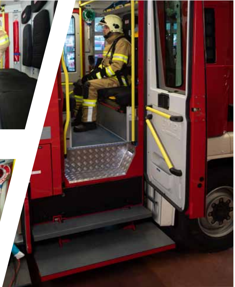
pneumatisch abklappbare Auftritte pneumatically folding access step