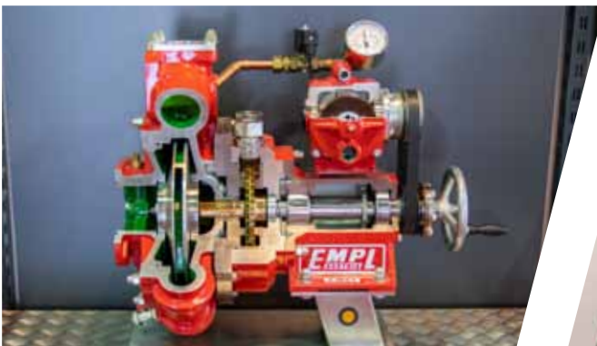
Pumpenschnitt mit Niederdruck und Hochdruck Pump section