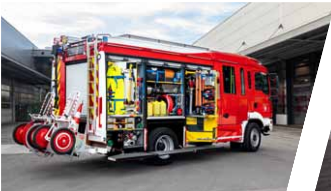
Hilfeleistungslöschgruppenfahrzeug, HLF 10 Pumper with rescue equipment, HLF 10