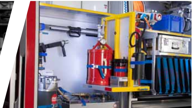
Drehfächer G5 - G6 optional Sliding trap in storage rooms G5 - G6