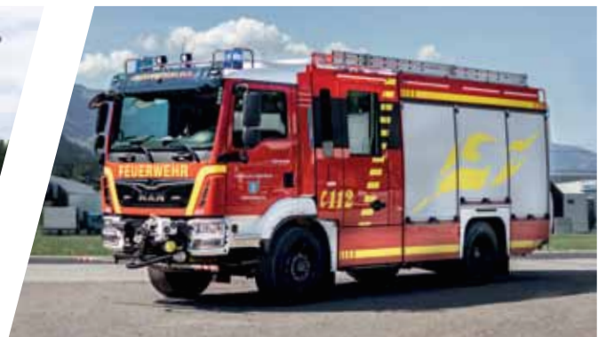
Löschgruppenfahrzeug, LF 20 Pumper, LF 20