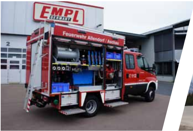
Mittleres Löschfahrzeug, MLF Medium-size Fire Fighting Vehicles, MLF