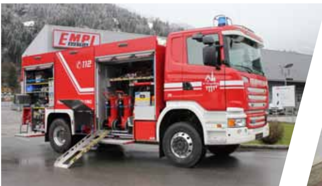
Tanklöschfahrzeug, TLF 4000 Pumper, TLF 4000