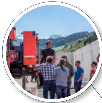
Hausinterne Abnahme durch das Empl Qualitätswesen inkl. Prüfung der Feuerlöscheinrichtung am Pumpenprüfstand In-house approval by the EMPL quality control department including checking of the fire extinguishing unit on the pump test stand