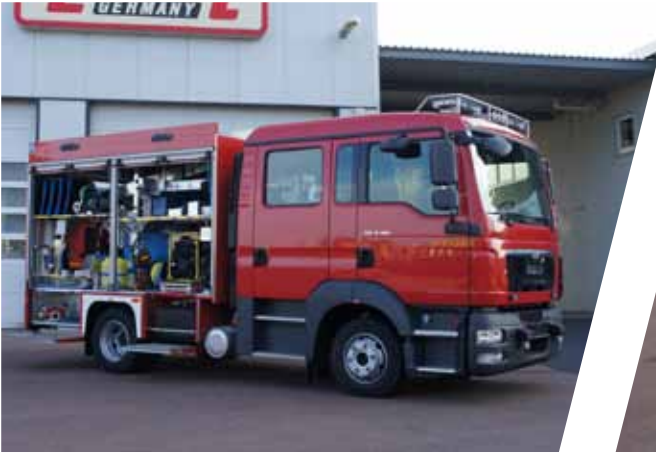
Tragkraftspritzenfahrzeuge, TSF-W Fire Fighting Vehicle with Portable Pump, TSF-W