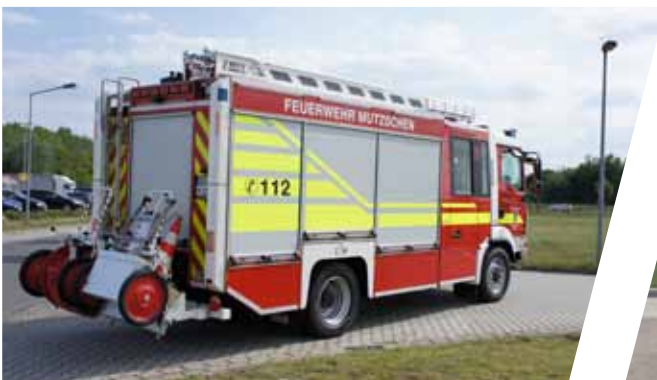
Hilfeleistungslöschgruppenfahrzeug, HLF 20 Pumper with rescue equipment, HLF 20