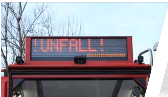
Verkehrsleiteinrichtung Rear warning system