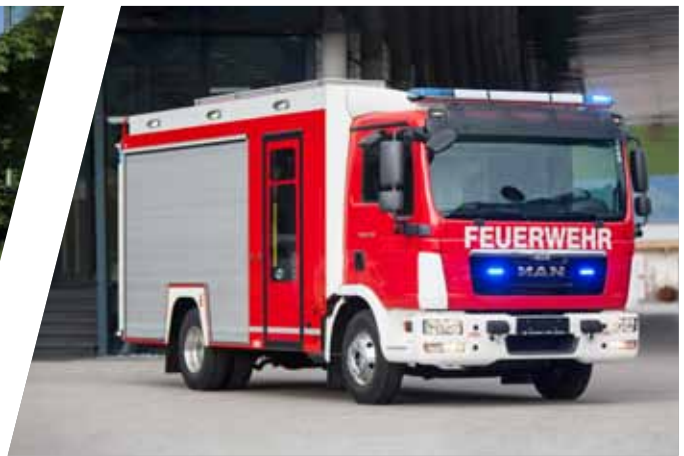
Mittleres Löschfahrzeug, MLF Medium-size Fire Fighting Vehicles, MLF