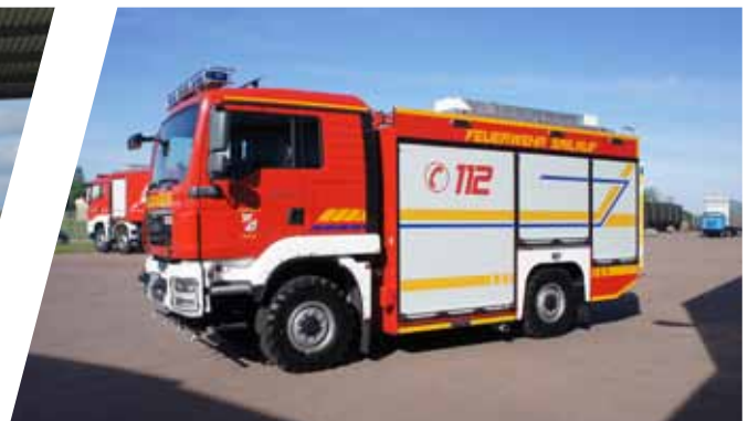
Tanklöschfahrzeug, TLF 3000 Pumper, TLF 3000