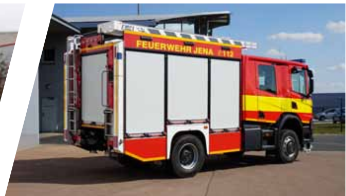
Löschgruppenfahrzeug Katastrophenschutz, LF 20 KatS Pumper, LF 20