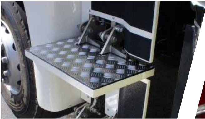
Pneumatisch ausklappbare Trittstufen, variabel ausführbar Pneumatic fold-out step, configured variably