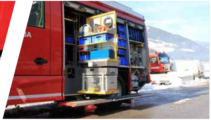
Drehwände variabel, getrennt oder durchgehend Rotating shelves