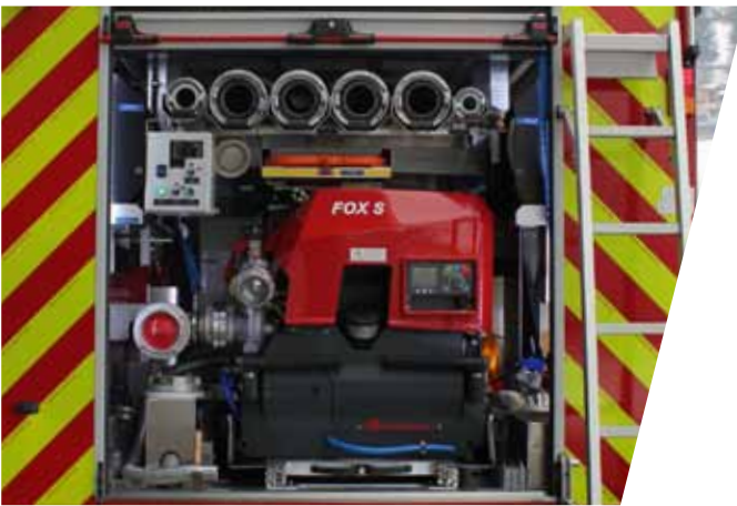
TS-Einbau im Fahrzeug-Heck Portable Pump at the tail end of the vehicle

„Perfekte Lösung für Ihre Herausforderung“ „Perfect solution for your challenge“