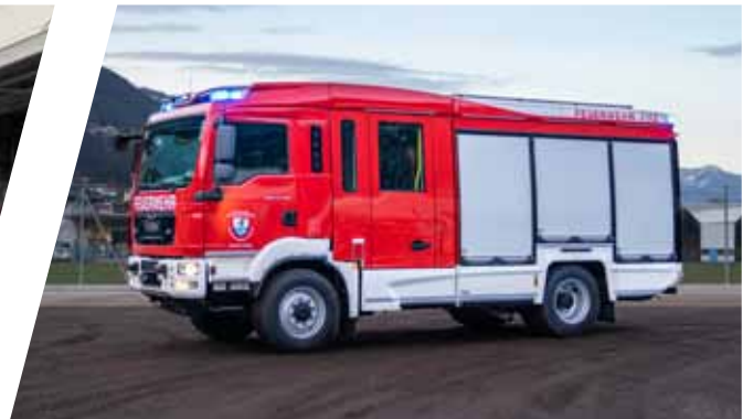
Löschgruppenfahrzeug, LF 10 Pumper, LF 10