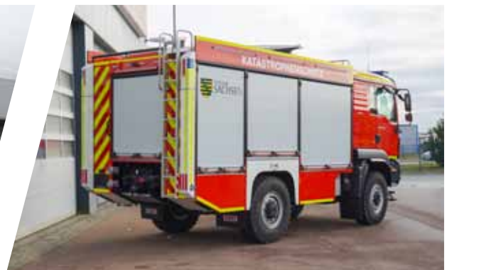
Tanklöschfahrzeug, TLF 4000 Pumper, TLF 4000