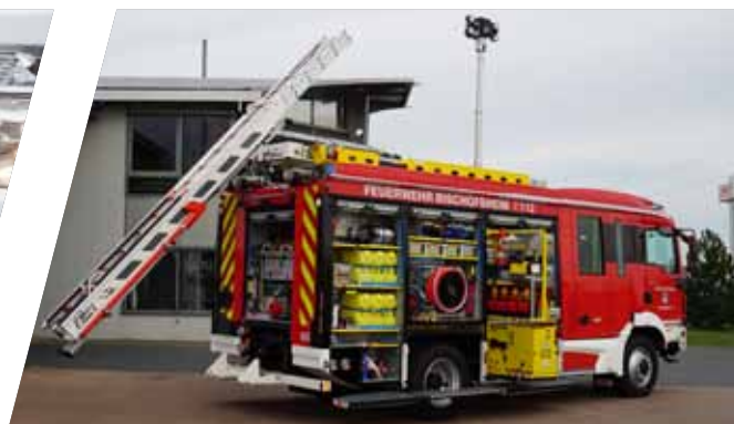
Mechanische oder elektrische Leiterabsenkung Ladder lowering device, mechanical or electrical