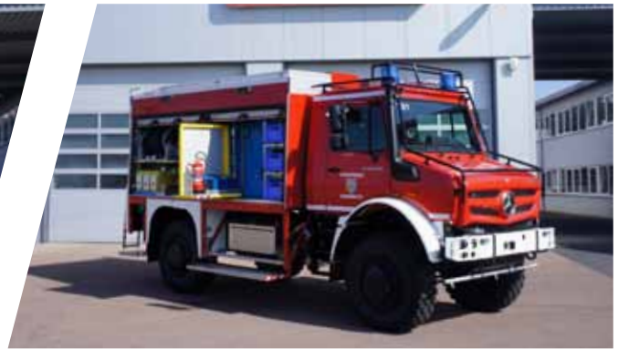
Tanklöschfahrzeug, TLF 2000 Pumper, TLF 2000