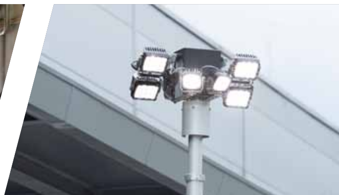
Lichtmast EMPL Function Light Lightmast EMPL Function Light