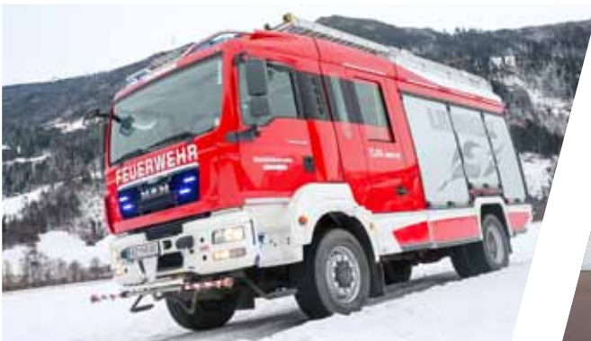
Tanklöschfahrzeug mit Staffelbesetzung, TLF 3000 Pumper, TLF 3000