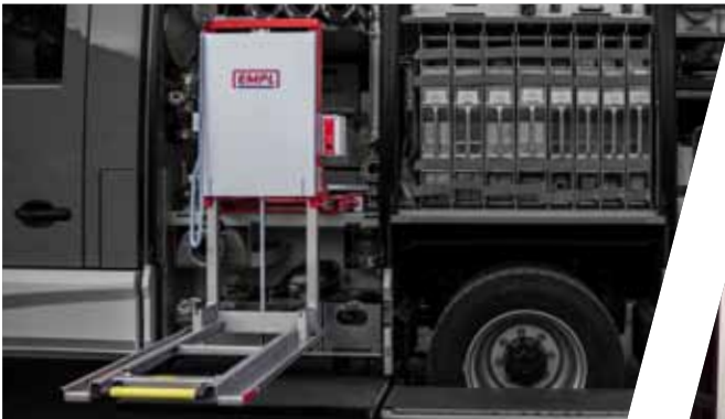
Tragkraftspritzenauszug Slide tray for portable fire fighting pump