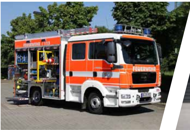
Mittleres Löschfahrzeug, MLF Medium-size Fire Fighting Vehicles, MLF