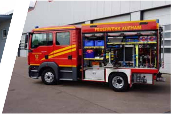
Tragkraftspritzenfahrzeuge, TSF-W Fire Fighting Vehicle with Portable Pump, TSF-W