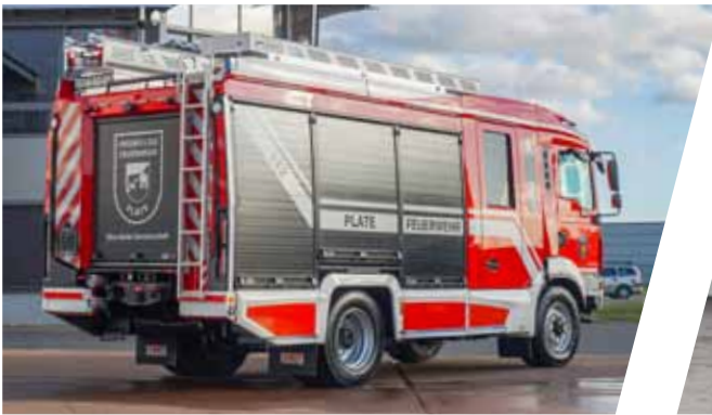
Hilfeleistungslöschgruppenfahrzeug, HLF 10 Pumper with rescue equipment, HLF 10