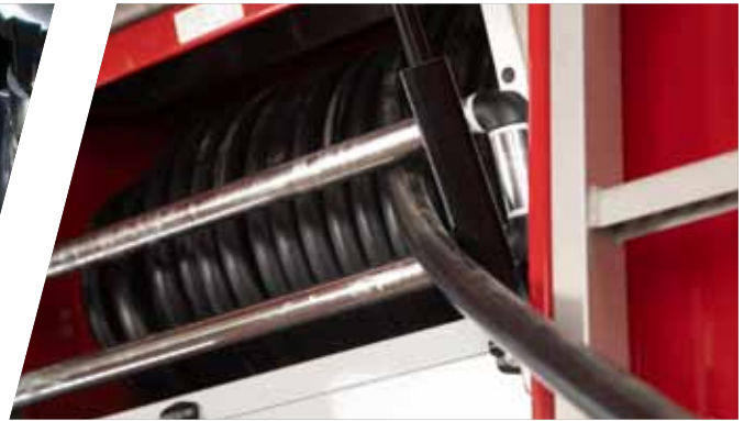
Führungsvorrichtung für Schnellangriff Guiding device for fast attack