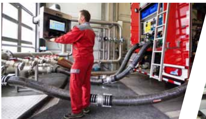
Pumpenprüfstand Pump test stand