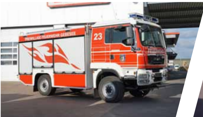
Tanklöschfahrzeug, TLF 3000 Pumper, TLF 3000