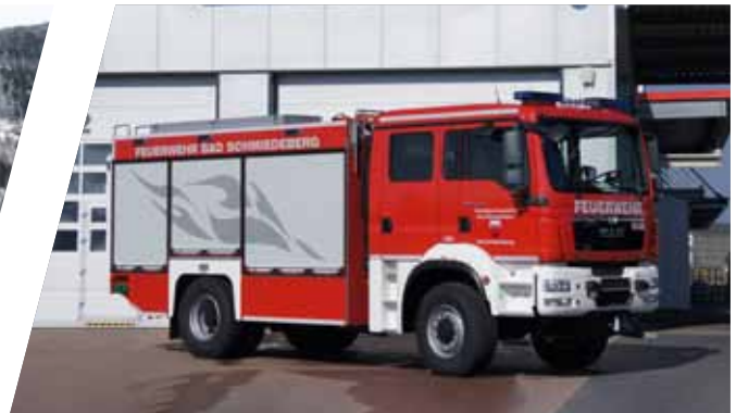
Tanklöschfahrzeug mit Staffelbesetzung, TLF 3000 Pumper, TLF 3000