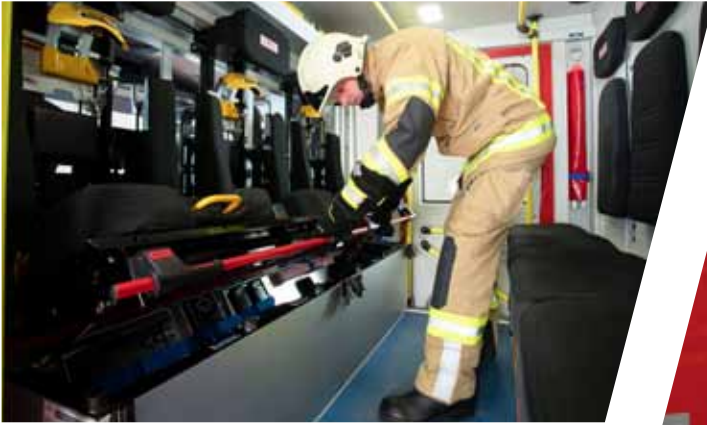
variabel einteilbarer Stauraum in Sitzkästen flexible partitioning of storage space in seat boxes