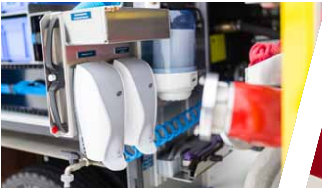
Hygieneboard auf Auszug Pull-out hygienic board