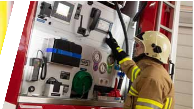
Ergonomisch bedienbare Pumpensteuerung nach Kundenwunsch Pump control / ergonomic operation