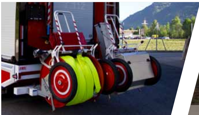
Haspelaufnahme Fire hose reel