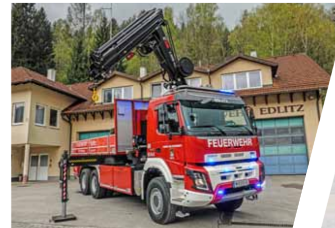
Wechseladefahrzeug mit Frontkran und AB-Pritsche