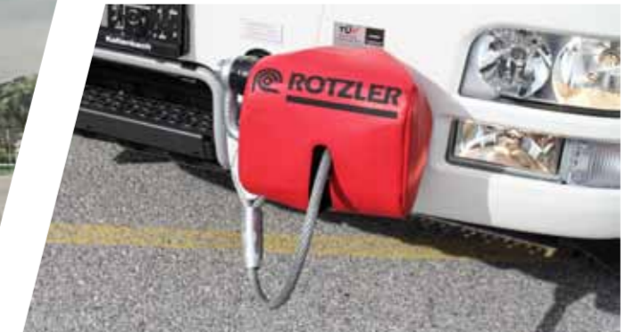
Seilwinden: Front- oder Rahmenmontage