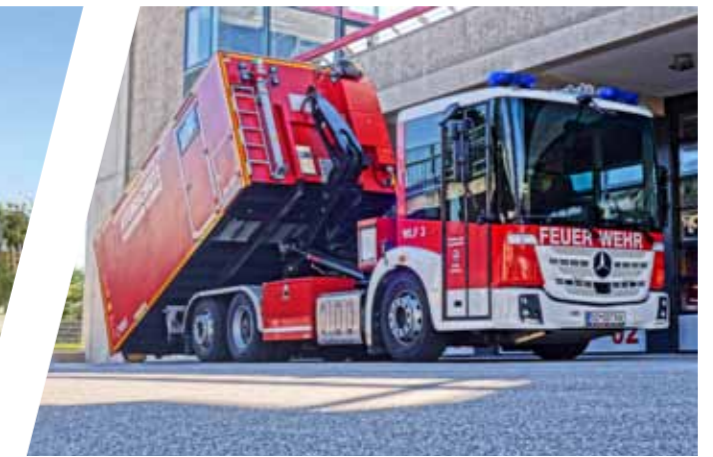
Wechseladefahrzeug mit AB-Hubschrauber