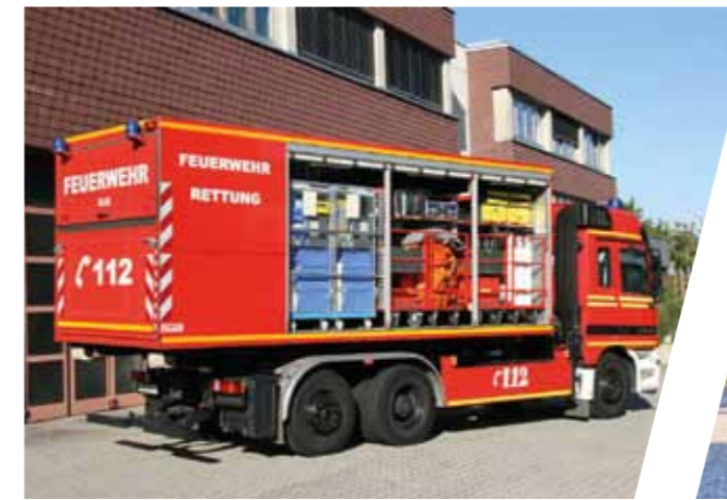
Wechseladefahrzeug mit AB-MANV

Die Abrollcontainer können wie die Chassis gebundenen Aufbauten mit den bewährten EMPL Beladungshalterungssystemen (Drehfächer, Schwenkwände, etc.) versehen werden um größtmögliche Sicherheit und Komfort bei Transport, Auf- und Absattelvorgängen sowie Entnahme zu gewährleisten.