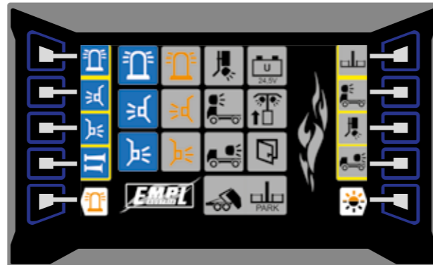
SMART-System: Übersichtlich und Komfortabel

Mit dem CAN - Bus System werden alle wichtigen Geräte gesteuert, Statusfunktionen abgerufen, Anlagenzustände beobachtet und die Ausführung von Befehlen überwacht. Es handelt sich um eine universelle Schnittstelle, die dazu dient, Informationen eines Steuergerätes für alle anderen nutzbar zu machen.