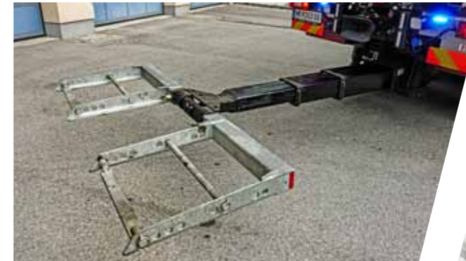
Hubbrille: Zweifach teleskopierbare LKW- und PKW-Abschleppvorrichtung mit einer Hublast von bis zu 5.000 kg

Sämtliche Anbauten (Hakengerät, Kran, Winden, Abschleppbrillen usw.) werden von unseren Mitarbeitern fachgerät im Haus montiert.