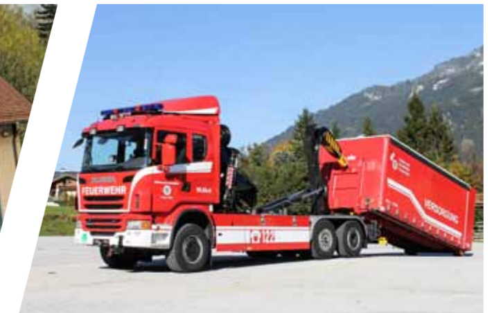
Wechseladefahrzeug mit Frontkran und AB-Logistik