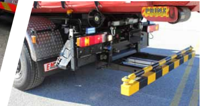
Unterfahrerschutz: Manuell, hydraulisch oder pneumatisch zu bedienender Unterfahrerschutz