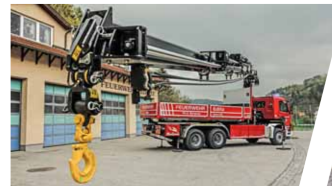
Frontkran: 27.6 tm