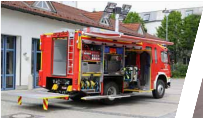
Gerätewagen, GW Support Vehicle