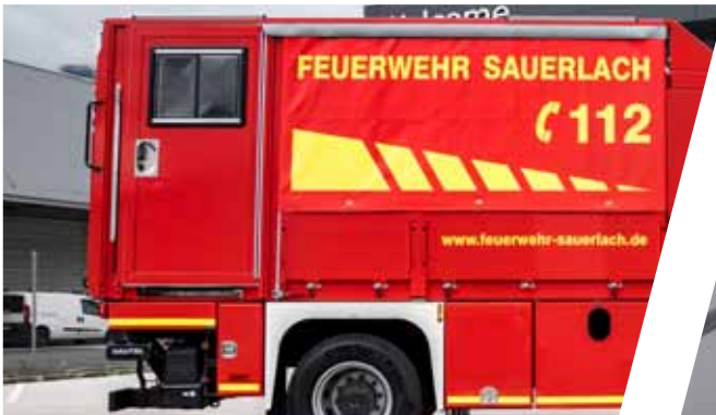
Seitlicher Türeinbau Side door