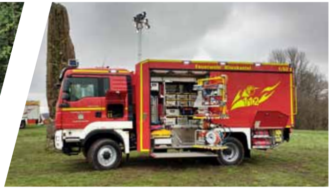
Gerätewagen, GW Support Vehicle