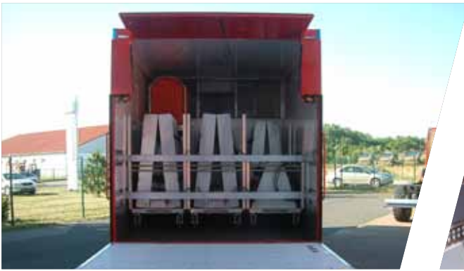
Sicherheitsverriegelung für den Rollcontainer-Transport Safety interlock for transport of roll-on containers