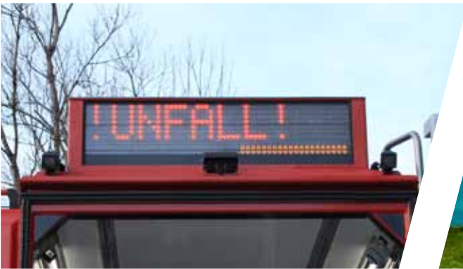
Verkehrsunfall Traffic guidance system