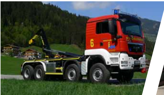
Wechseladefahrzeug, WLF Hook Loading System