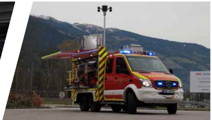
Ausfahrbare Markise Extendable awning