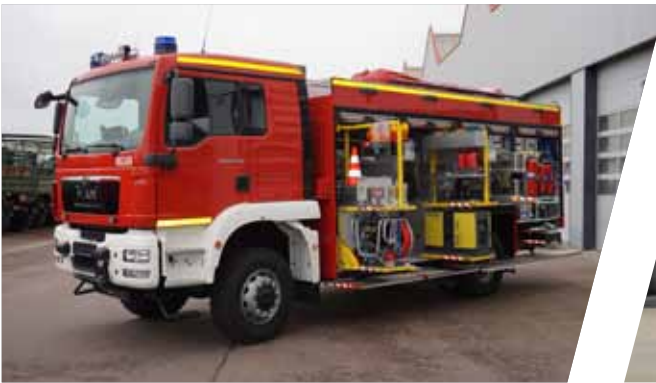
Rüstwagen, RW Rescue Vehicle