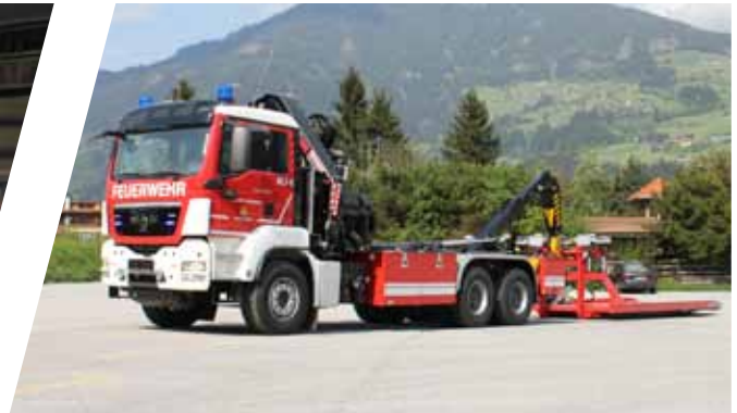
Wechseladefahrzeug mit Kran, WLF-K Hook Loading System with crane