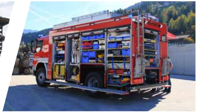
Rüstwagen, RW Rescue Vehicle