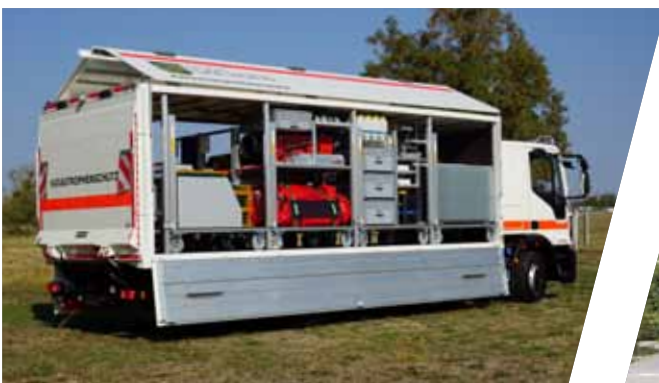
Gerätewagen für Katastrophenschutz, GW-KatS Support Vehicle for disaster management