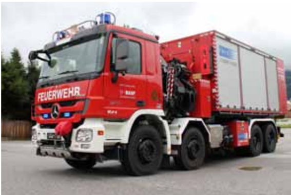
Wechseladefahrzeug mit Kran, WLF-K Hook Loading System with crane