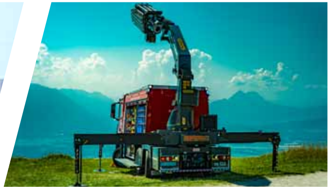
Heckkran Rear crane