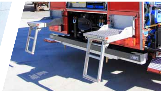
Variable Aufstiegsstufen Individual access steps