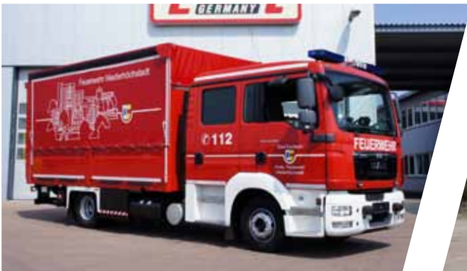
Gerätewagen, GW Support Vehicle