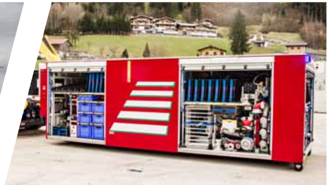
Abrollbehälter Wasser / Schaum Roll-off container water / foam