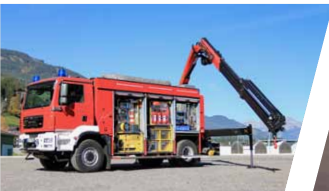
Rüstwagen mit Kran, RW-K Rescue Vehicle with crane