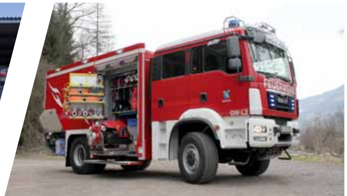
Gerätewagen, GW Support Vehicle