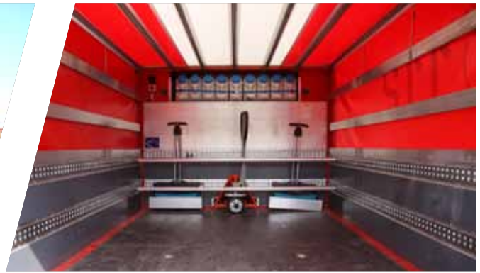
Hintere Gerätehalterung für individuelles Kundenzubehör Mountings for individual devices