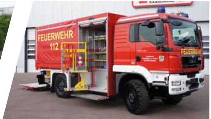
Gerätewagen, GW Support Vehicle