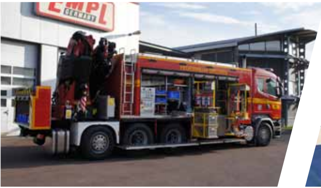
Rüstwagen mit Kran, RW-K Rescue Vehicle with crane