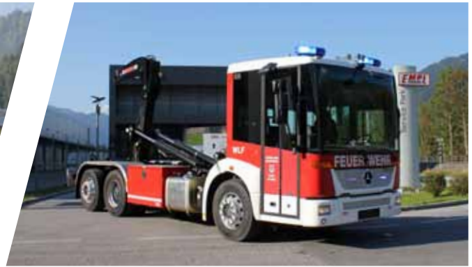
Wechseladefahrzeug, WLF Hook Loading System