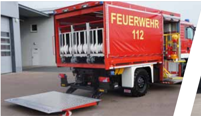
Optimale Raumnutzung durch maßgeschneiderte Rollcontainer Custom-made roll-on containers for an ideal use of space