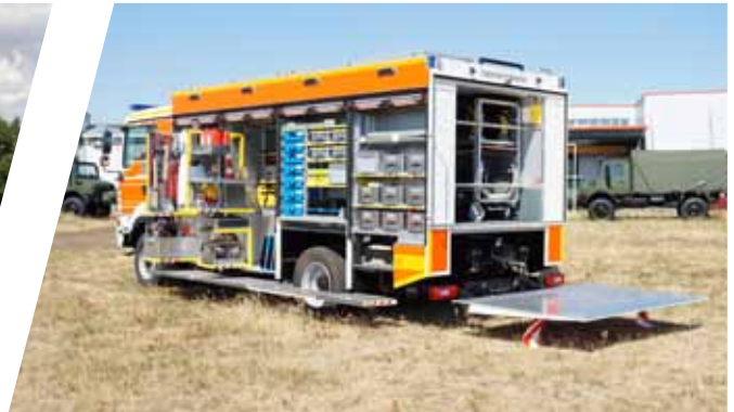
Rüstwagen, RW Rescue Vehicle