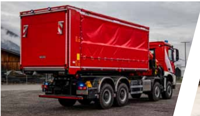
Abrollbehälter mit Ladebordwand Roll-off container with tail lift