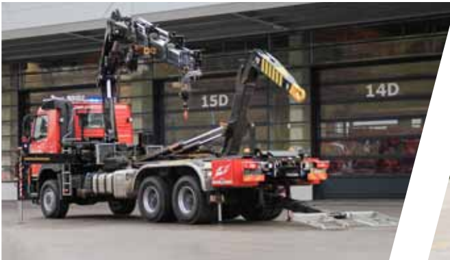
Wechseladefahrzeug mit Kran, WLF-K Hook Loading System with crane