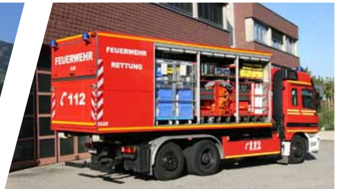
Wechseladefahrzeug, WLF Hook Loading System