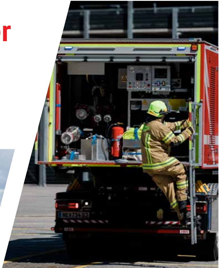
Abrollbehälter mit Wasser / Schaum Tank Roll-off container with water / foam tank