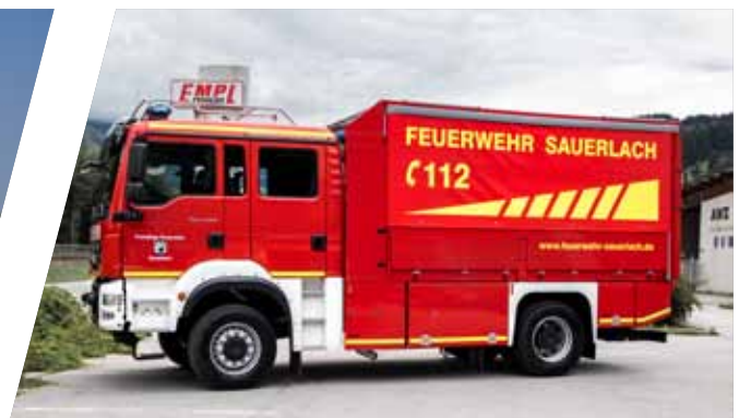
Gerätewagen, GW-V Support Vehicle