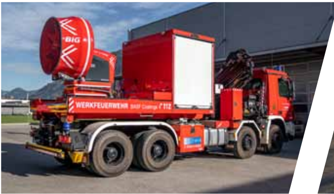
Abrollbehälter mit Groß-Raum-Lüfter Roll-off container with ventilator