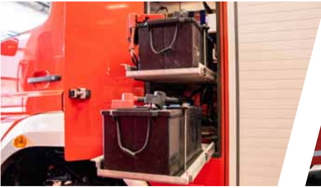
Batterien seitlich hinter dem Fahrerhaus eingebaut Batteries behind the drivers cab