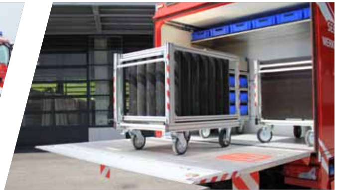
Platzsparende Rollcontainer-Variante Space-saving version of a roll-on container