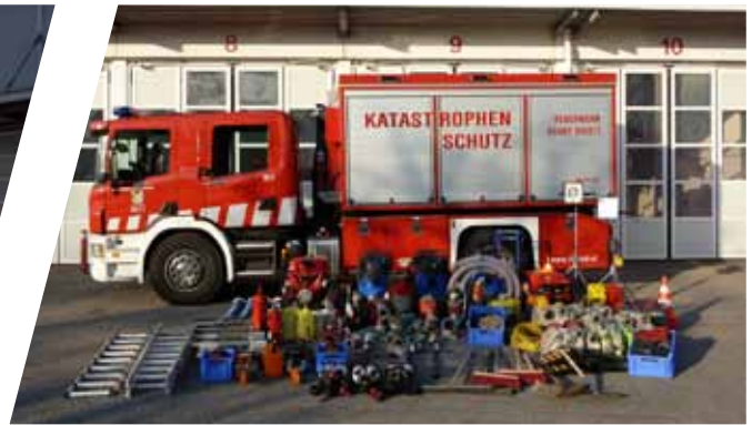
Abrollbehälter Katastrophenschutz Roll-off container for disaster management