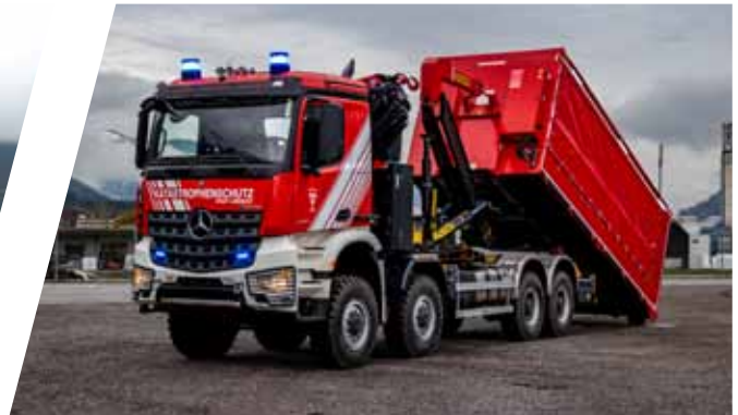
Wechseladefahrzeug mit Kran, WLF-K Hook Loading System with crane