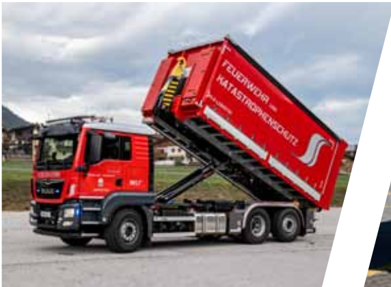
Abrollbehälter Logistik Roll-off container logistic