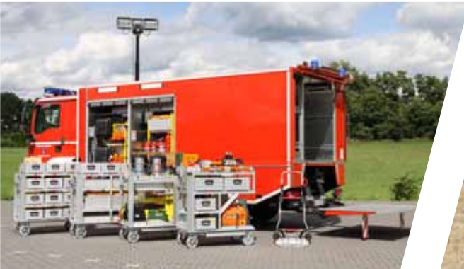
Rüstwagen, RW Rescue Vehicle