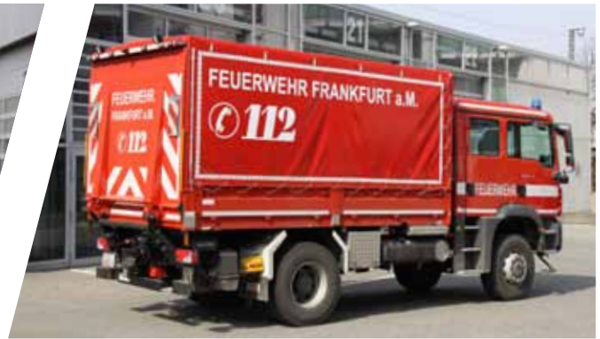
Rüstwagen, RW Rescue Vehicle