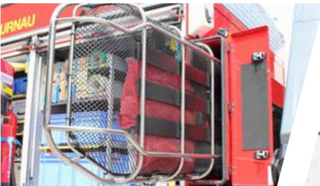
Rettungstrage für Bergereinsätze Stretcher for rescue operations