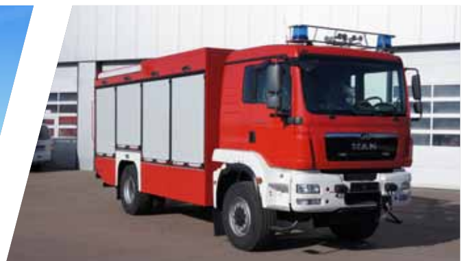
Rüstwagen, RW Rescue Vehicle