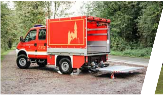
Gerätewagen, GW-L1 Support Vehicle