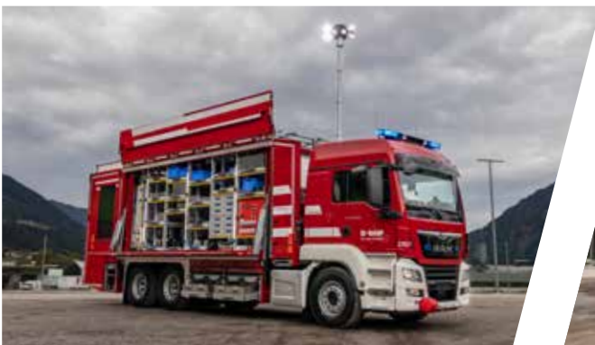
Rüstwagen mit Seiten- und Hecklift Rescue Vehicle with side and rear lift