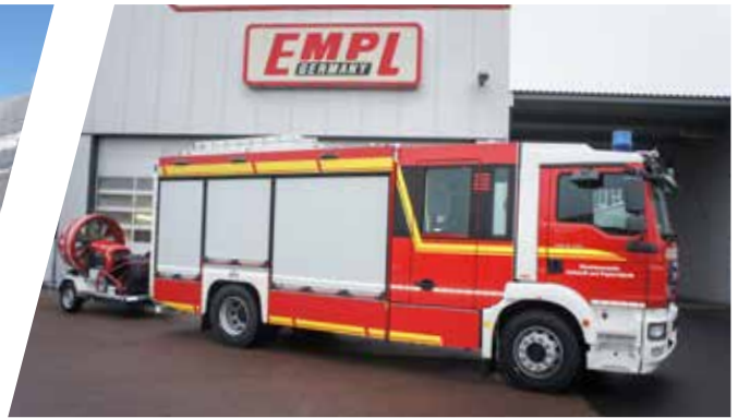
Hilfeleistungstanklöschfahrzeug, HTLF Pumper with rescue equipment