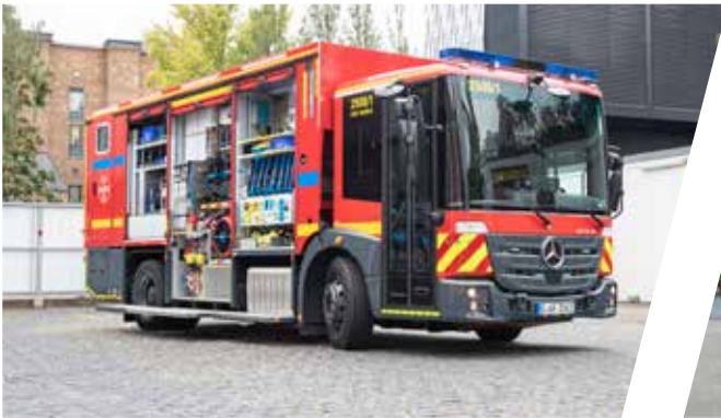
Hilfeleistungstanklöschfahrzeug, HTLF Pumper with rescue equipment