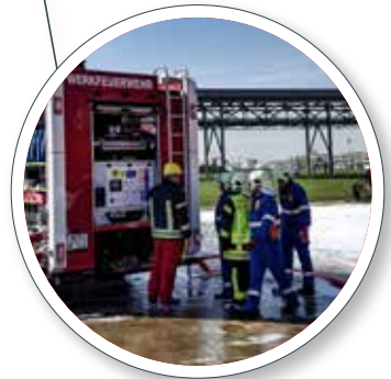
Abnahme und Einschulung mit dem Kunden Acceptance and training with the customer