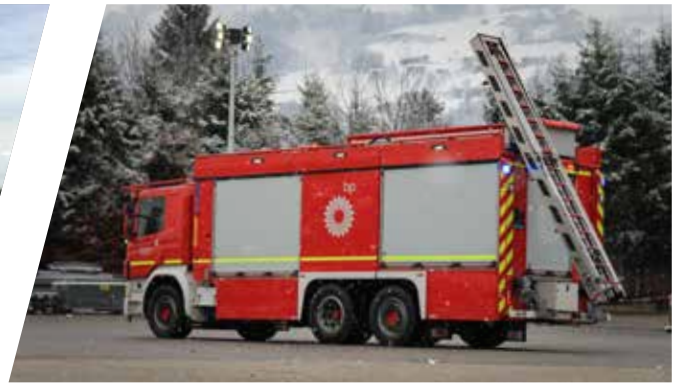
Pulver-Tanklöschfahrzeug, PTLF Pumper with powder