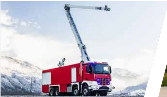
Industriellöschfahrzeug mit Scorpio Löscharm, ILF Industrial Fire Fighting Vehicle with extinguishing boom „Scorpio“