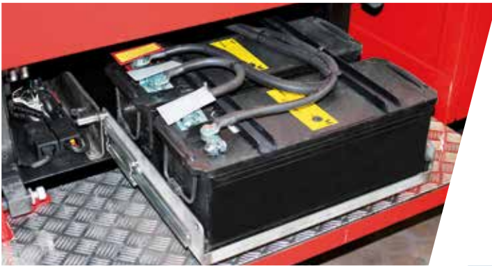
Fahrgestell-Batterien auf Edelstahl auszug hinter Trittstufen

Chassis batteries behind the fold-out step on a stainless steel extension