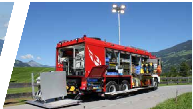
DEKON Fahrzeug Decontamination Vehicle