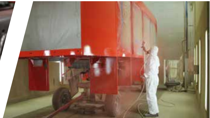
Hochwertige Aufbaulackierung High-quality body coating