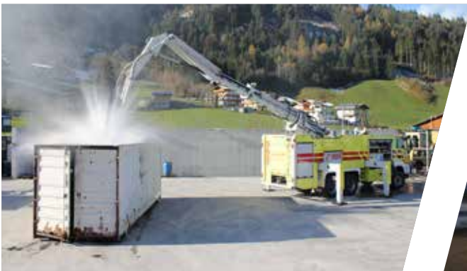
Löscharm mit piercing Funktion Force Entry Vehicle