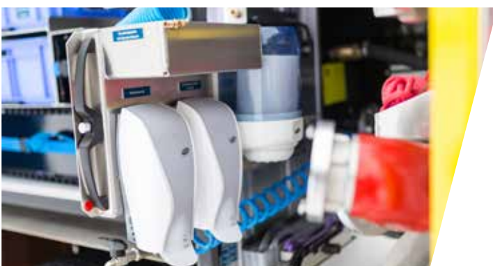
Hygieneboard auf Auszug