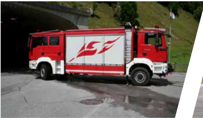
Tunnellöschfahrzeug, TLF 2000/400 Tunnel Fire Fighting Vehicle