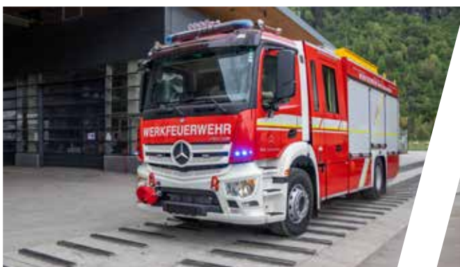
Rütteltest Vibration test