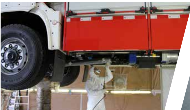
Langanhaltender Schutz durch professionelle Konservierung Durable protection due to professional conservation