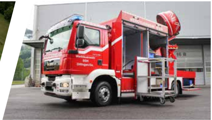
Großraum-Lüfter-Fahrzeug, GLF Ventilation Vehicle