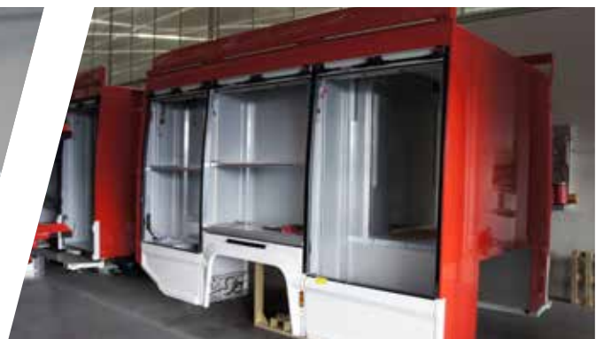
Aufbau aus kunststoffbeschichteten Aluminium Sandwich-Paneelen Body made of aluminium sandwich panels