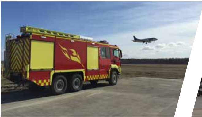
Flugfeldlöschfahrzeug Airport Fire Truck