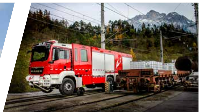
Zweibegefahrzeug Two-way Vehicle (Rail-Road)