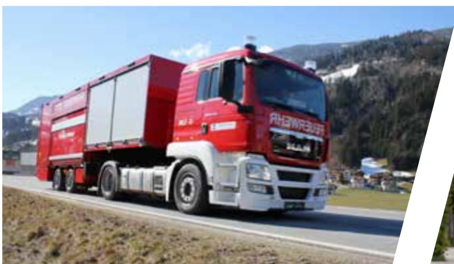
Sattelaufleger Gefahrgut HAZMAT Semi-Trailer