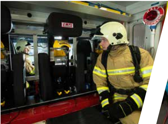
großzügige Kommunikationsöffnung generously sized communication opening