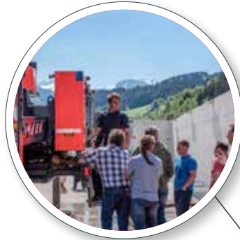
Hausinterne Abnahme durch das Empl Qualitätswesen inkl. Prüfung der Feuerlöscheinrichtung am Pumpenprüfstand In-house approval by the EMPL quality control department including checking of the fire extinguishing unit on the pump test stand