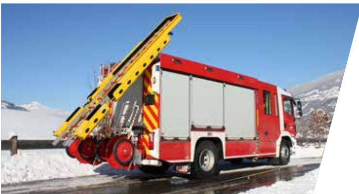
Mechanische / elektrische Leiterabsenkvorrichtung mit Saugschlauchhalterung

Mechanic / electrical driven ladder lowering mechanism with brackets for suction hoses