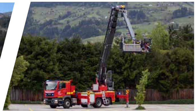
Hubarmrettungsbühne, HAB Aerial platform with pump