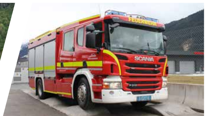
Verwindungstest Torsion test