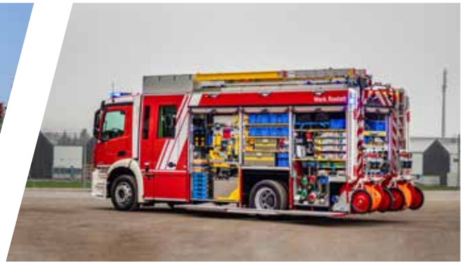
Hilfeleistungslöschgruppenfahrzeug, HLF Pumper with rescue equipment