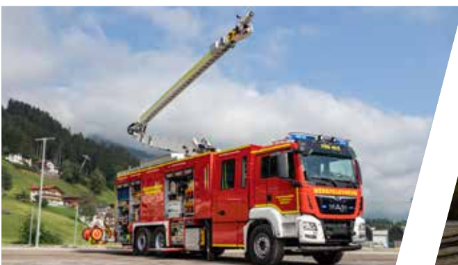
Industriellöschfahrzeug mit Scorpio Löscharm, ILF Industrial Fire Fighting Vehicle with extinguishing boom „Scorpio“