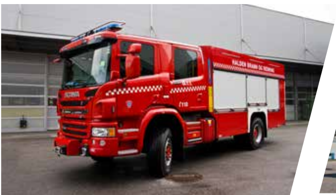
Tanklöschfahrzeug, TLF 3000/50/50 Pumper