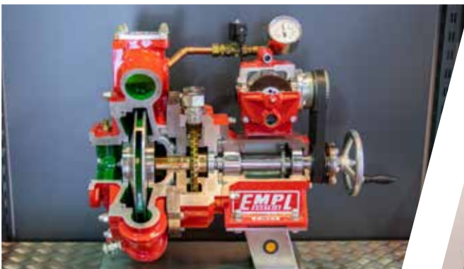
Pumpenschnitt Pump section