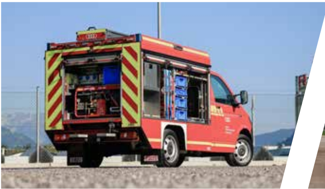
Vorauslöschfahrzeug, VLF Rapid intervention vehicle