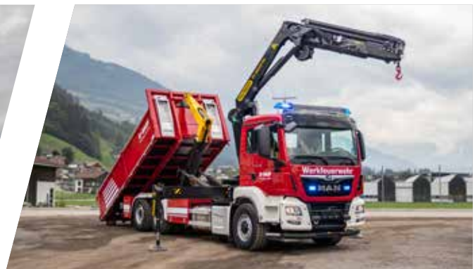
Abrollpritsche Hook Loading System with Cargo Body