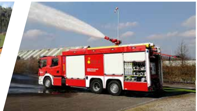
Universallöschfahrzeug, ULF Industrial Fire Fighting Vehicle