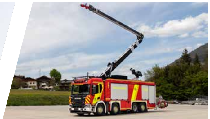
Universallöschfahrzeug mit Scorpio Löscharm, ULF Industrial Fire Fighting Vehicle with extinguishing boom „Scorpio“