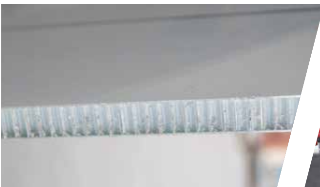
Wabenkernpaneel Honeycombed panels