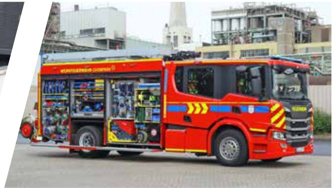
Hilfeleistungslöschgruppenfahrzeug, HLF Pumper with rescue equipment