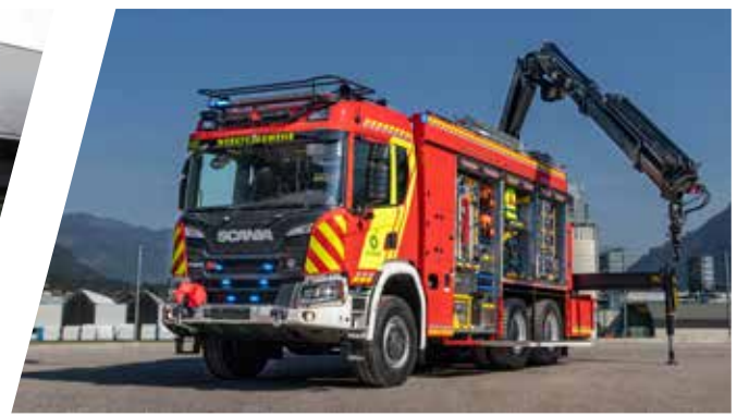
Rüstwagen mit Kran, RW-K Heavy Rescue Vehicle with crane