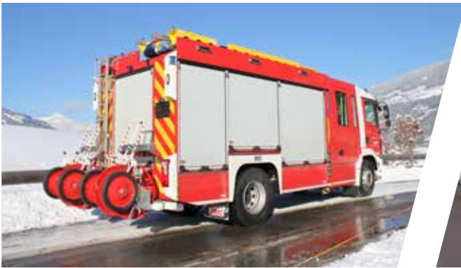
Tanklöschfahrzeug, TLF Pumper