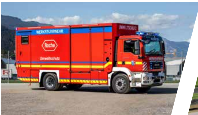
Gerätewagen Logistisch, GW-L Support Vehicle HAZMAT